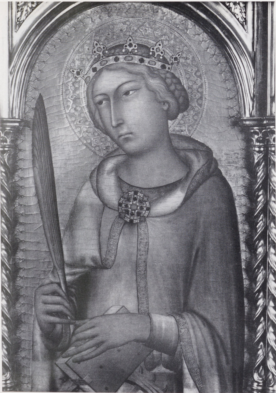
Abb. 3 Simone Martini und Werkstatt, Die hl. Katharina. Privatbesitz