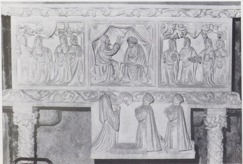
Abb. 1b Abtei S. Spirito (bei Sulmona), Grabmal des Restaino Caldora († 1412) von Gualterius de Alemania (V. Pace)