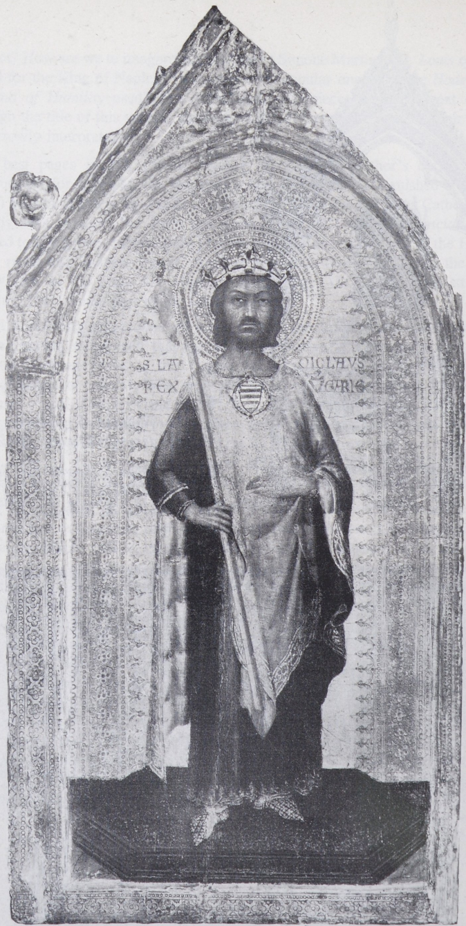
Abb. 2 Simone Martini, Der hl. Ladislaus. Altomonte (Cosenza), S. Maria della Consolazione, Museum