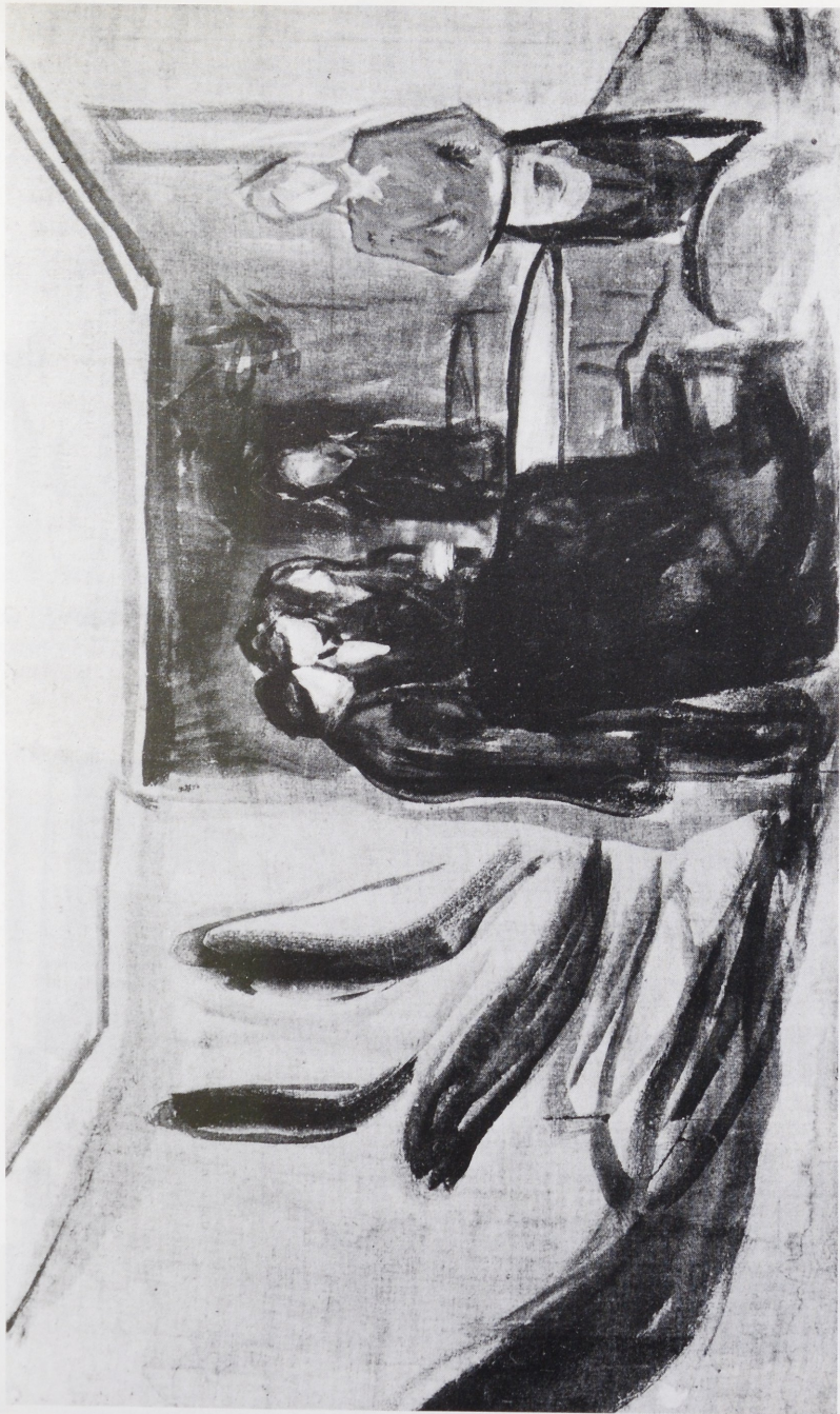
Abb. 1 Edvard Munch, Szenenentwurf zu „Gespenster“ von Henrik Ibsen, 1906