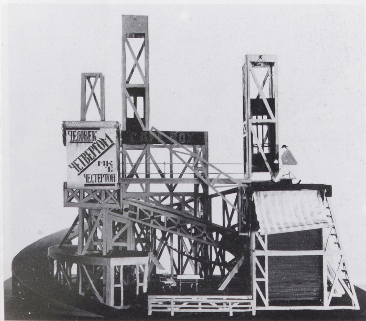
Abb. 3b Alexander Wesnin, Bühnenmodell zu „Der Mann, der Donnerstag war“ von Gilbert K. Chesterton, 1923