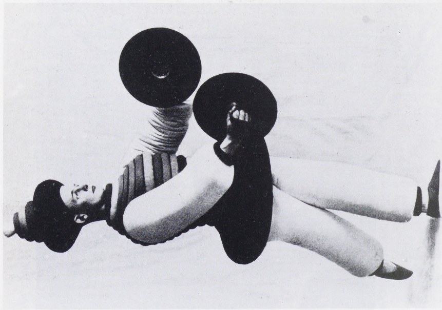
Abb. 2b Oskar Schlemmer im Kostüm des „Türken“ des „Triadischen Ballets“, 1922