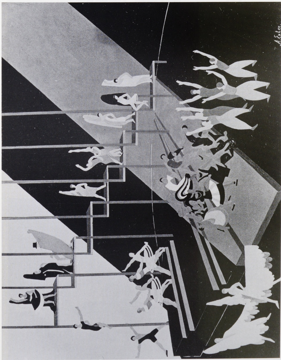
Abb. 4 Alexandra Exter, Entwurf für eine Bühnenrevue, 1925