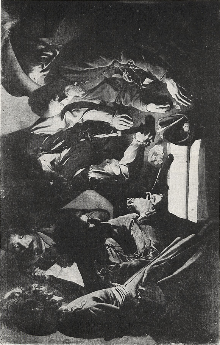
Abb. 2 Georges de la Tour: Ungedentete Szene. Lwow, Museum