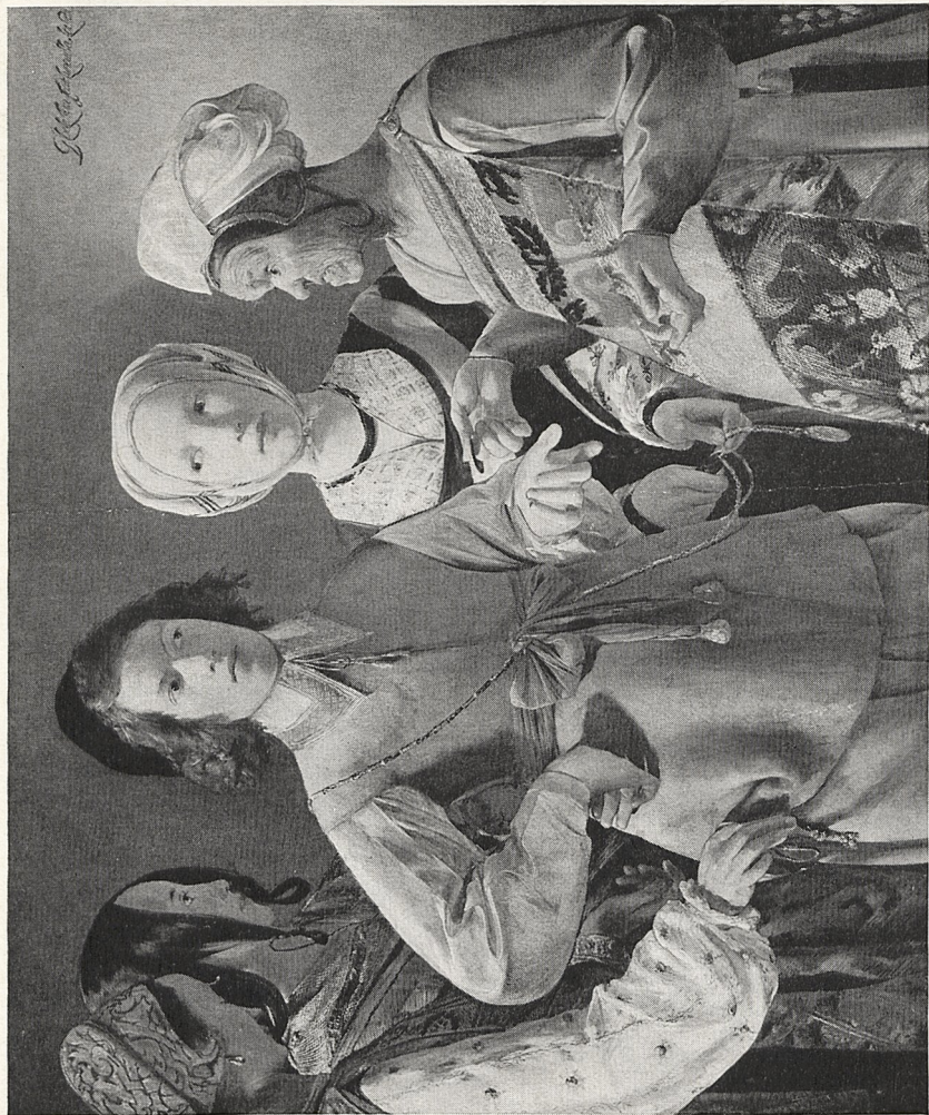
Abb. 3 Georges de la Tour: La Diseuse de la bonne aventure . New York, Metropolitan Museum of Art