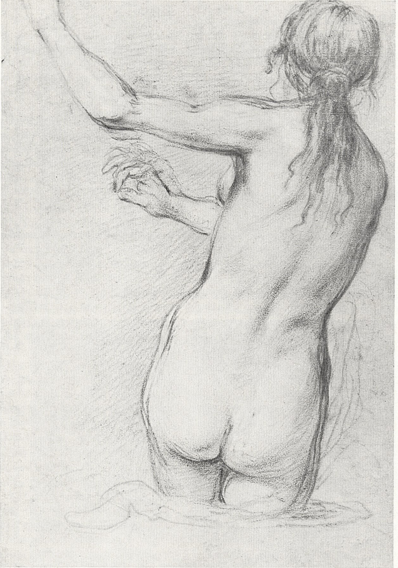
Abb. 2 Francesco Furini (zugeschr.): Weiblicher Rückenakt. Rötel (recto von Abb. 3), London, Privatbesitz.