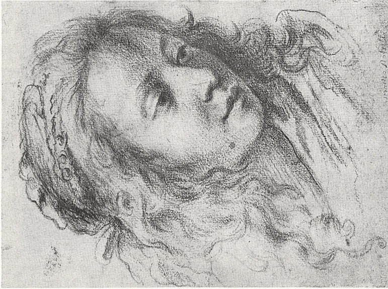
Abb. 1a Francesco Furini (zugeschr.; bisher: Matteo Rossetti): Mädchenkopf. Schwarze u. rote Kreide. Berlin, Kupferstichkabinett (KdZ 18189)