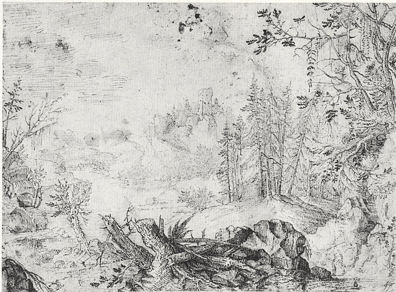
Abb. 4a Sebastian Furck: Landschaft. Feder. Düsseldorf, Kunstmuseum