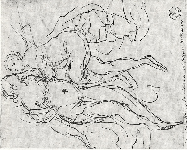
Abb. 1b Francesco Furini (zugeschr.; bisher: Cesare Dandini): Pittura e Poesia. Federskizze zu dem Gemälde von 1626. Florenz, Uffizien (Inv. No. 15236)