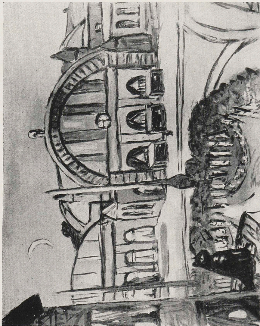
Abb. 2. Max Beckmann, Erinnerung an den Frankfurter Hauptbahnhof (1943). Frankfurt, Privatbesitz