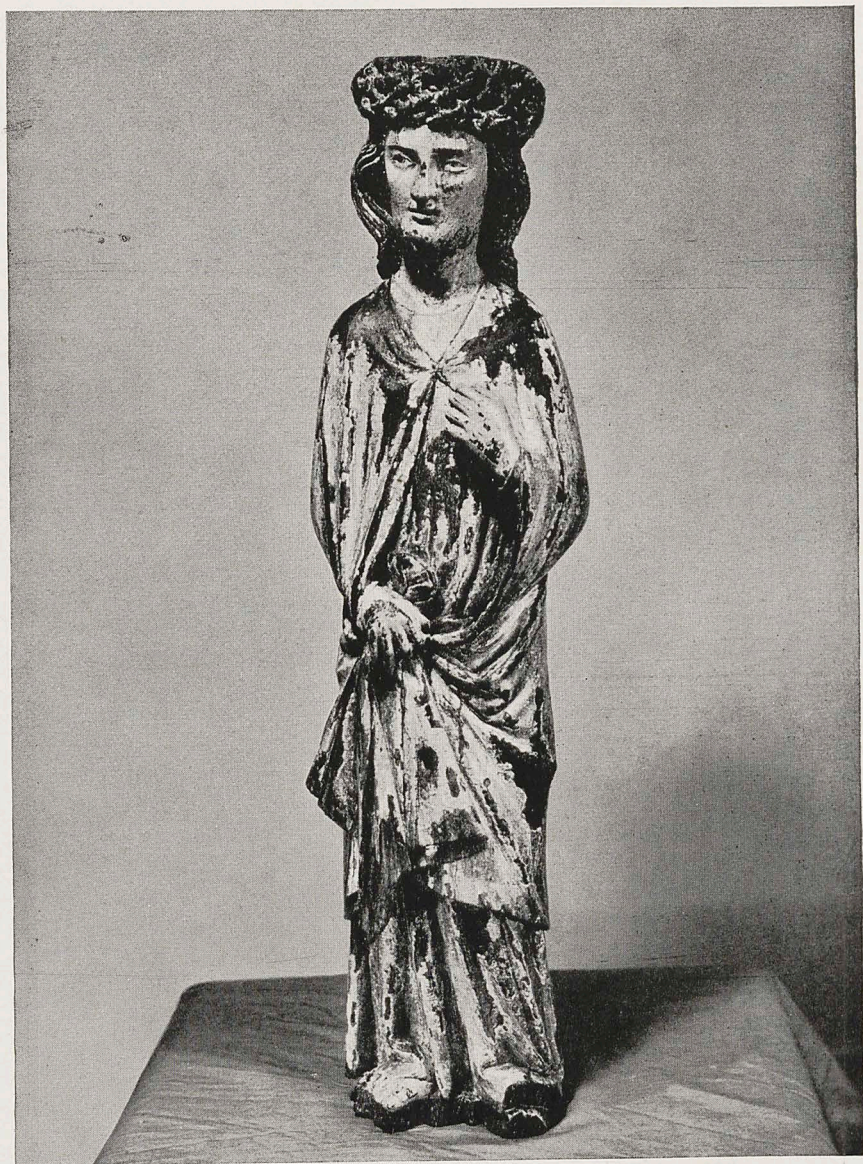
Abb. 4 Seeschwaben-Hochrhein, um 1320: Ecce-Homo-Christus. Höhe 85 cm Donaueschingen, Fürstl. Fürstenbergische Sammlungen