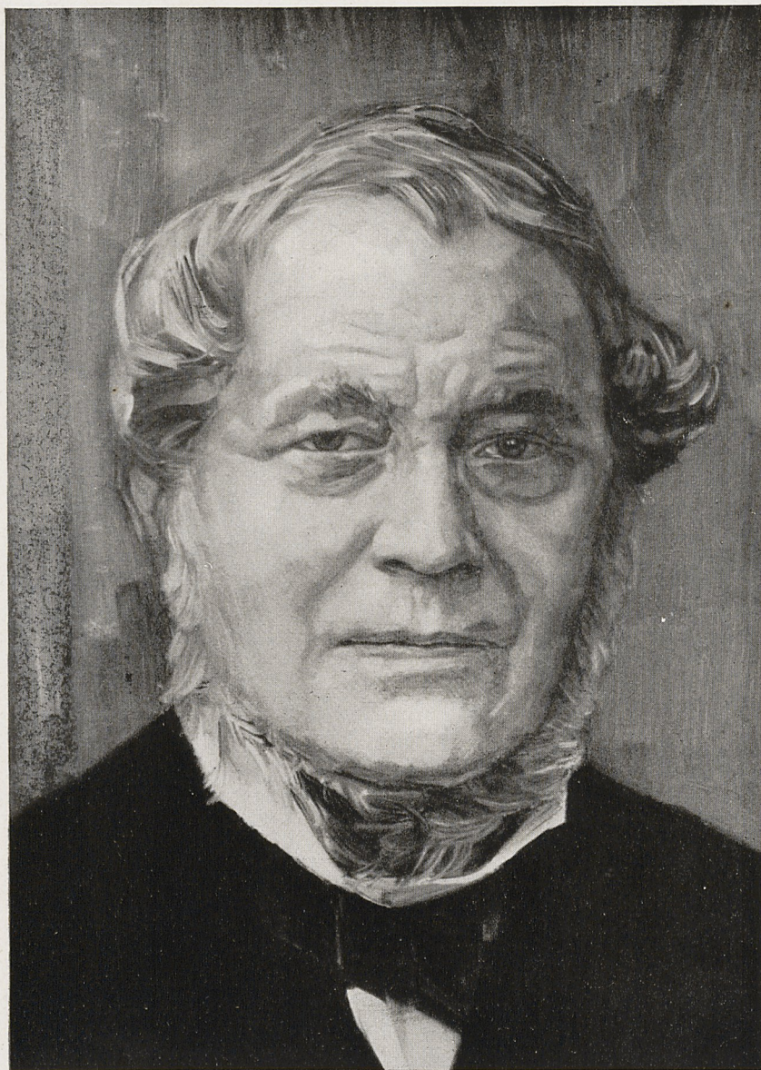
Abb. 3 Wilhelm Trübner, 1906: Bildnis Robert Bunsen München, Deutsches Museum