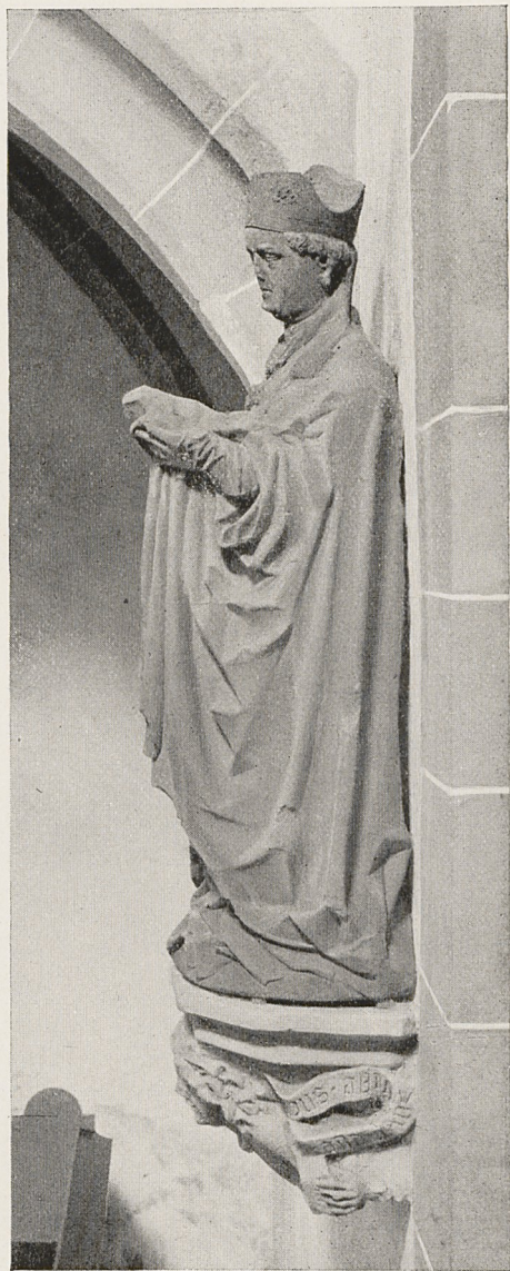
Abb. 1 und 2 Schwäbisch um 1440: Hl. Januarius Murrhardt, Stadtkirche (vgl. Kunstchronik, Okt. 1951, S. 237)