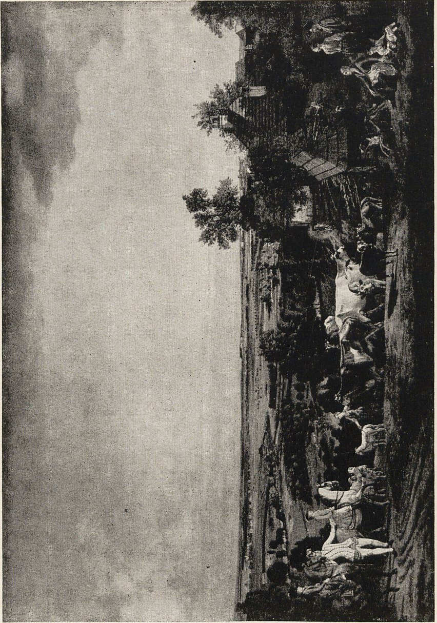
Abb. 4 Bernardo Bellotto: Ansicht der Weichselebene bei Warschau Warschau, Nationalmuseum