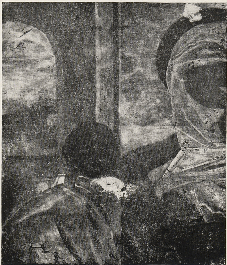
Abb. 2 Giorgione: Selbstbildnis. Braunschweig, Herzog-Anton-Ulrich-Museum Röntgenaufnahme von dem Fragment einer Madonna, Montage von 4 Einzelfilmen