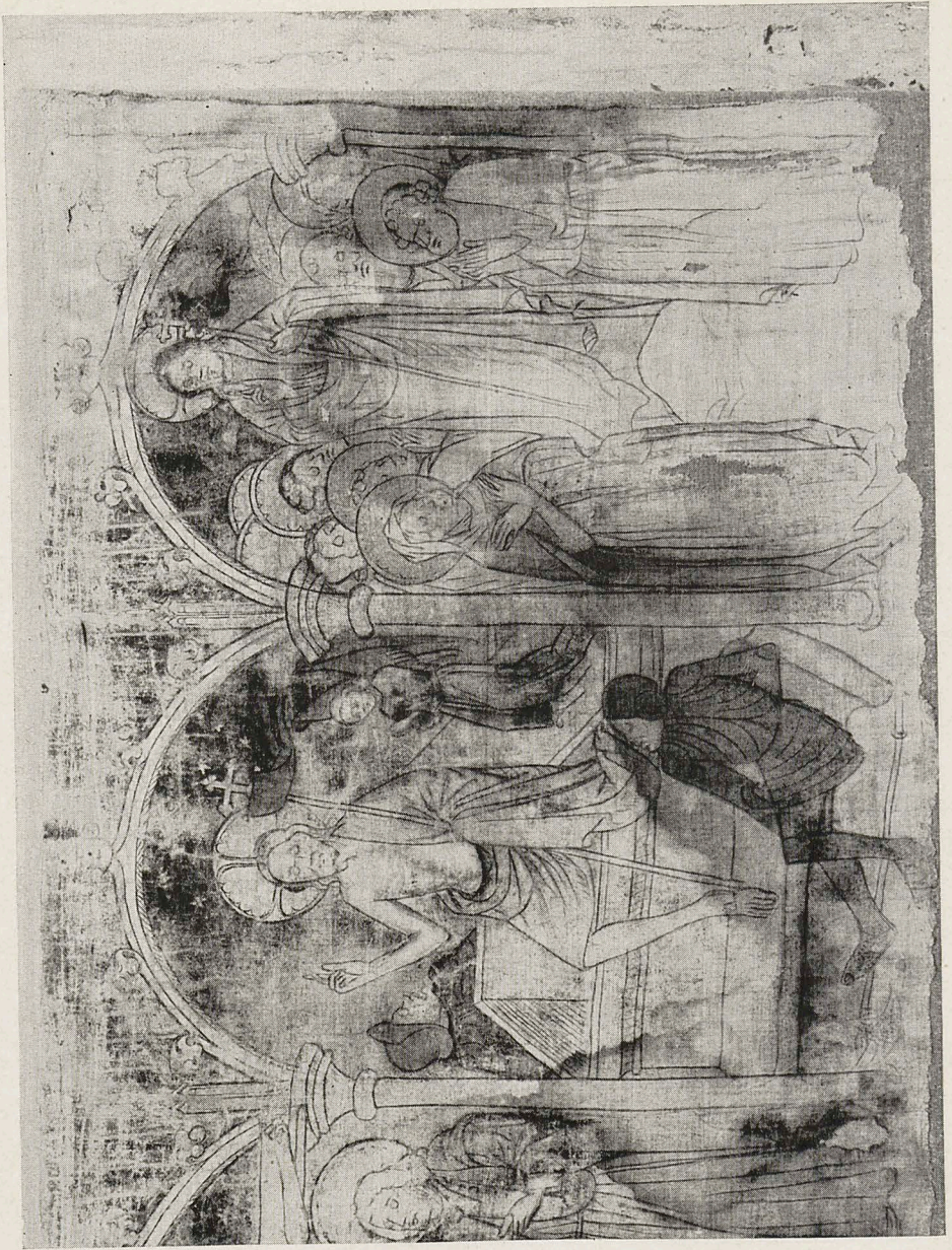
Abb. 4 Niedersächsisch, Mitte 15. Jh.: Antependium aus Wismannsburg (Ausschnitt). Hannover, Niedersächsische Landesgalerie