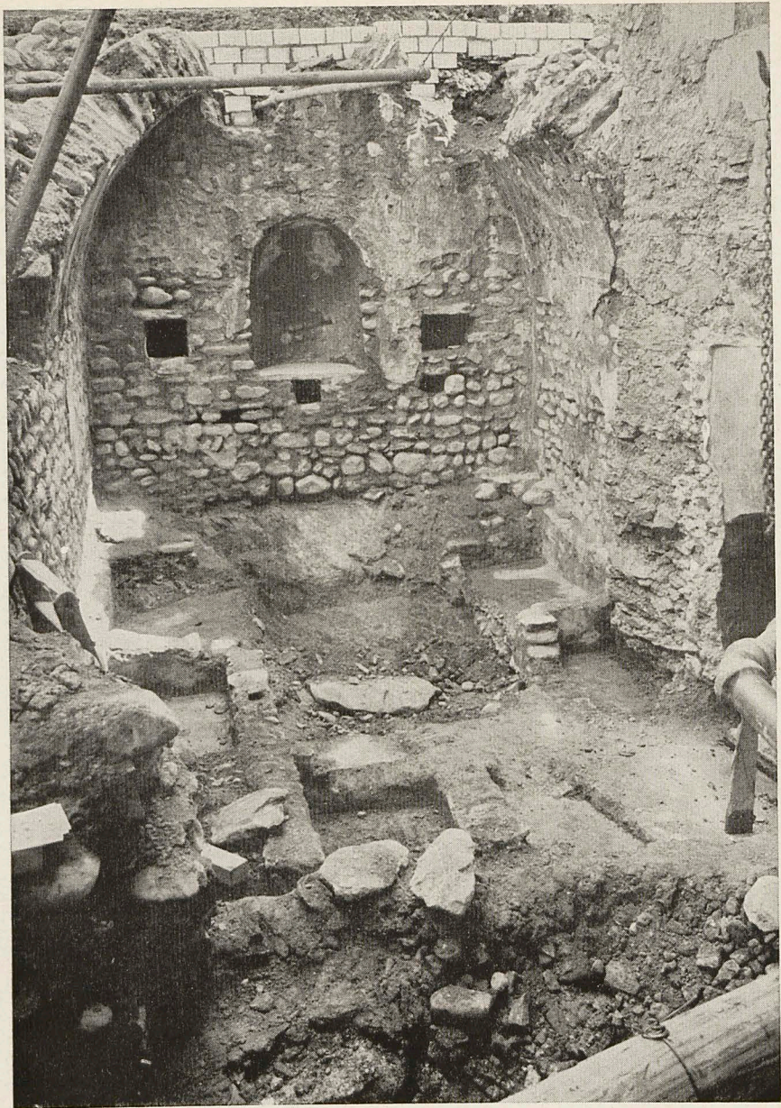
Abb. 3 Chur, St. Stephanskirche, Grab-Hauptkammer gegen Osten gesehen