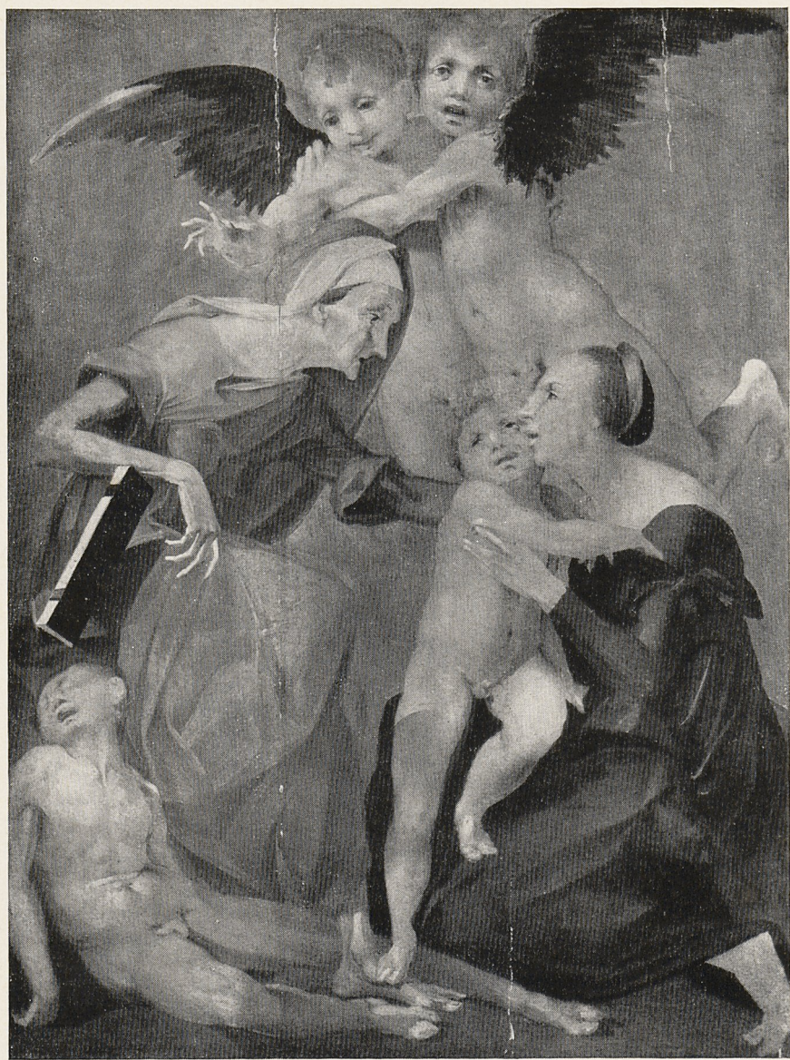
Abb. 2 Rosso Fiorentino: Heilige Familie. Los Angeles, County Museum