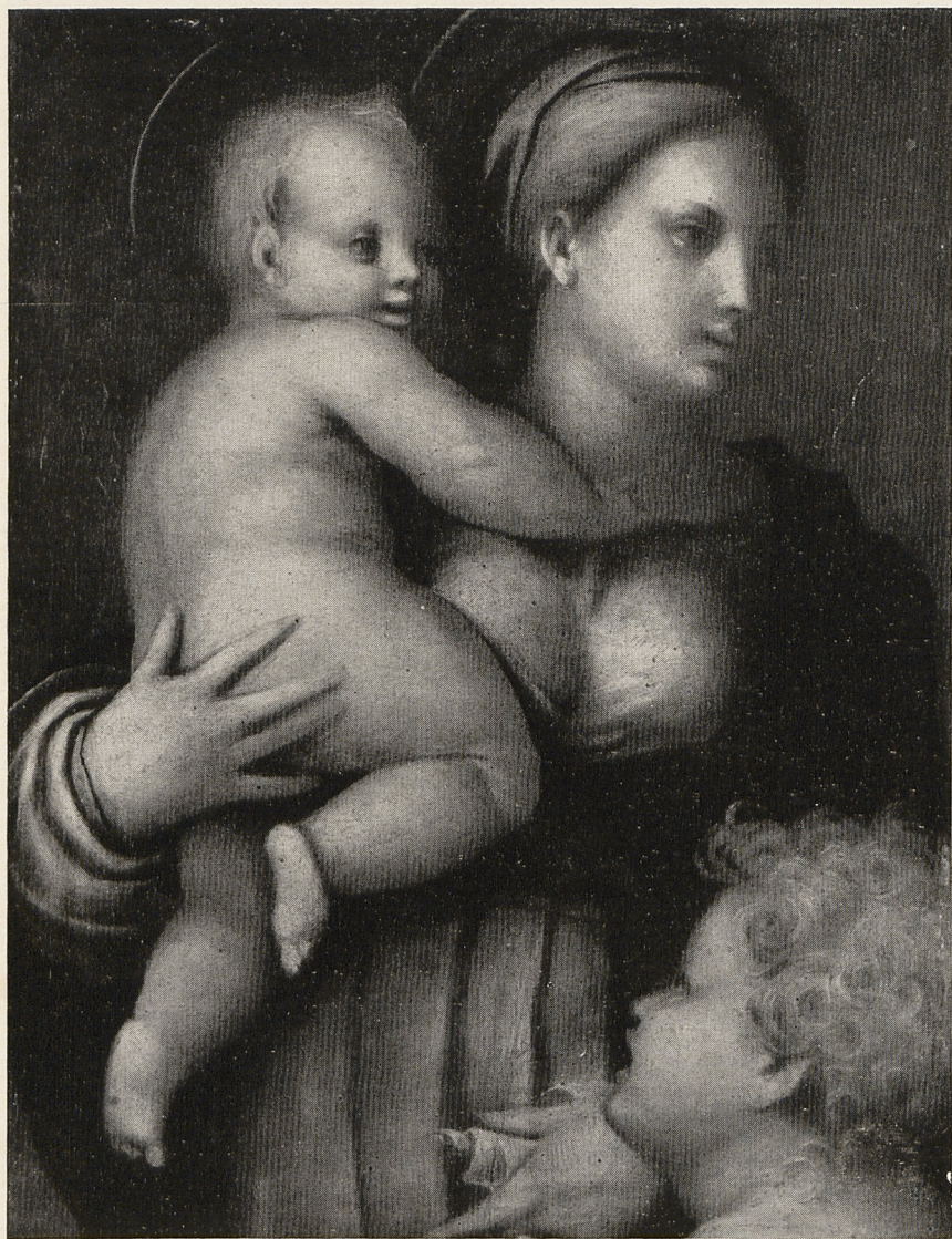
Abb. 1 Pontormo: Madonna. Florenz, Poggio Imperiale