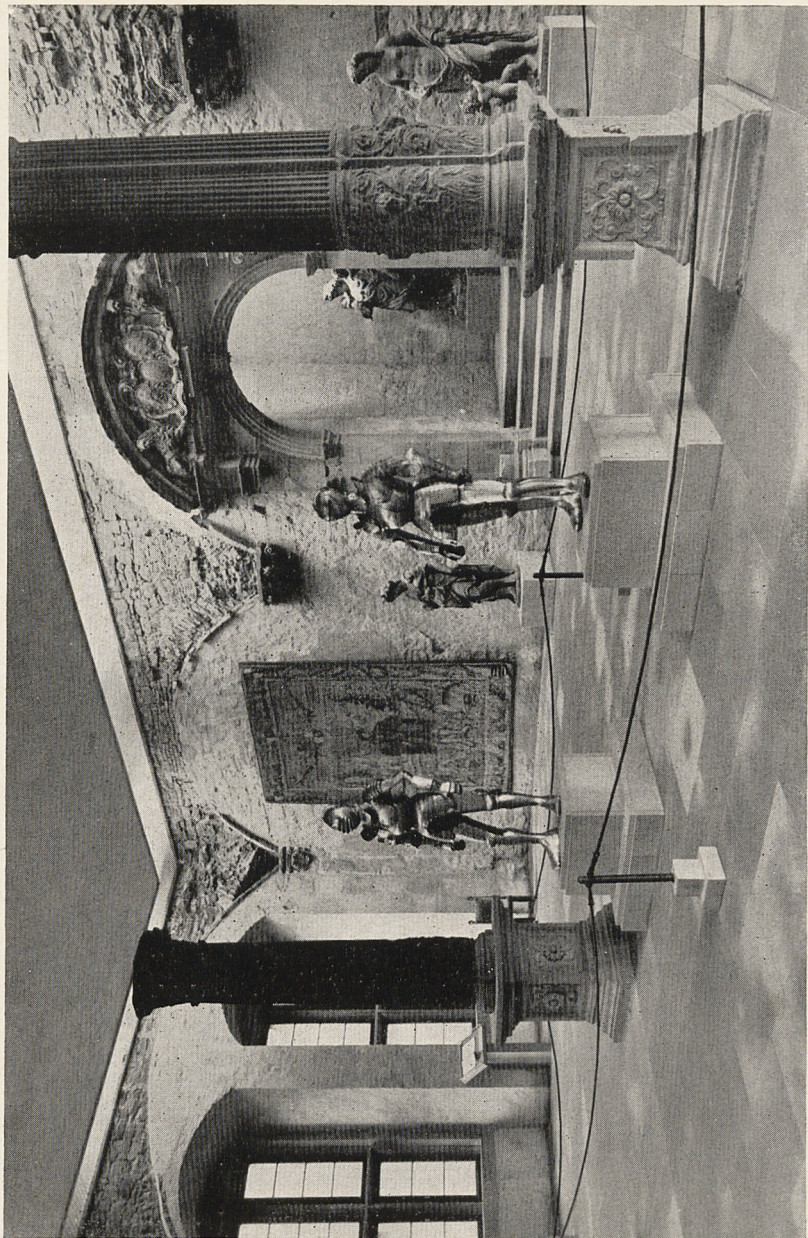
Abb. 4 Ottheinrich-Ausstellung im Kaisersaal des Ottheinrichsbaues, Heidelberg