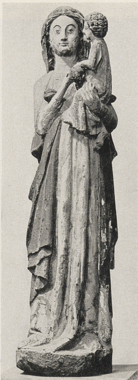
14 Abb. 2 Stehende Madonna. Nörvenich (Krs. Düren), Pfarrkirche