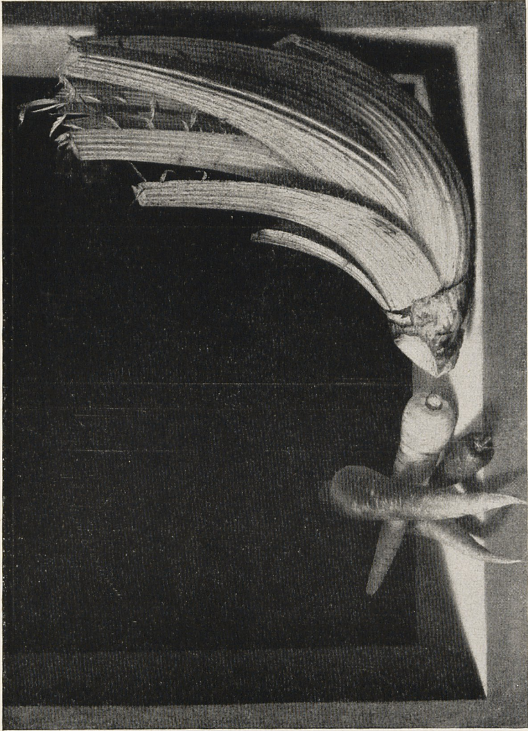
Abb. 4 Sánchez Cotán: Stilleben. Granada, Museo Provincial. (Um 1602 - 5)