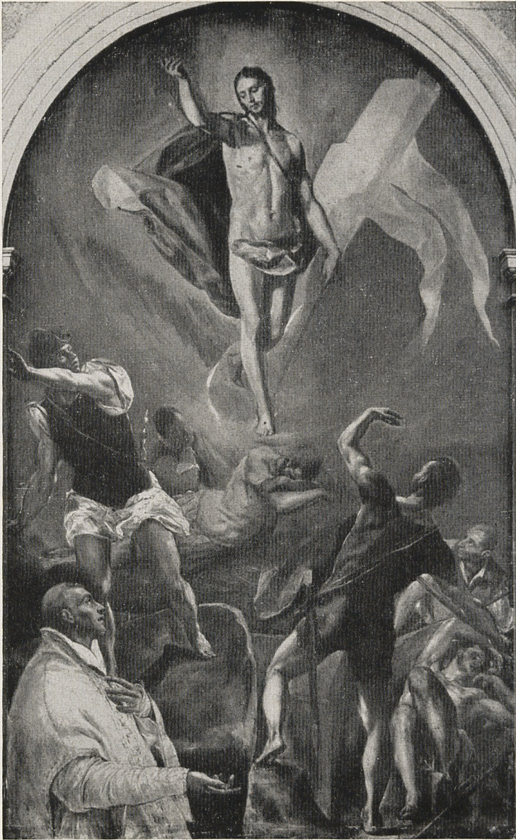
Abb. 2 El Greco: Auferstehung Christi. Toledo, Sto. Domingo el Antiguo. (1577/79)