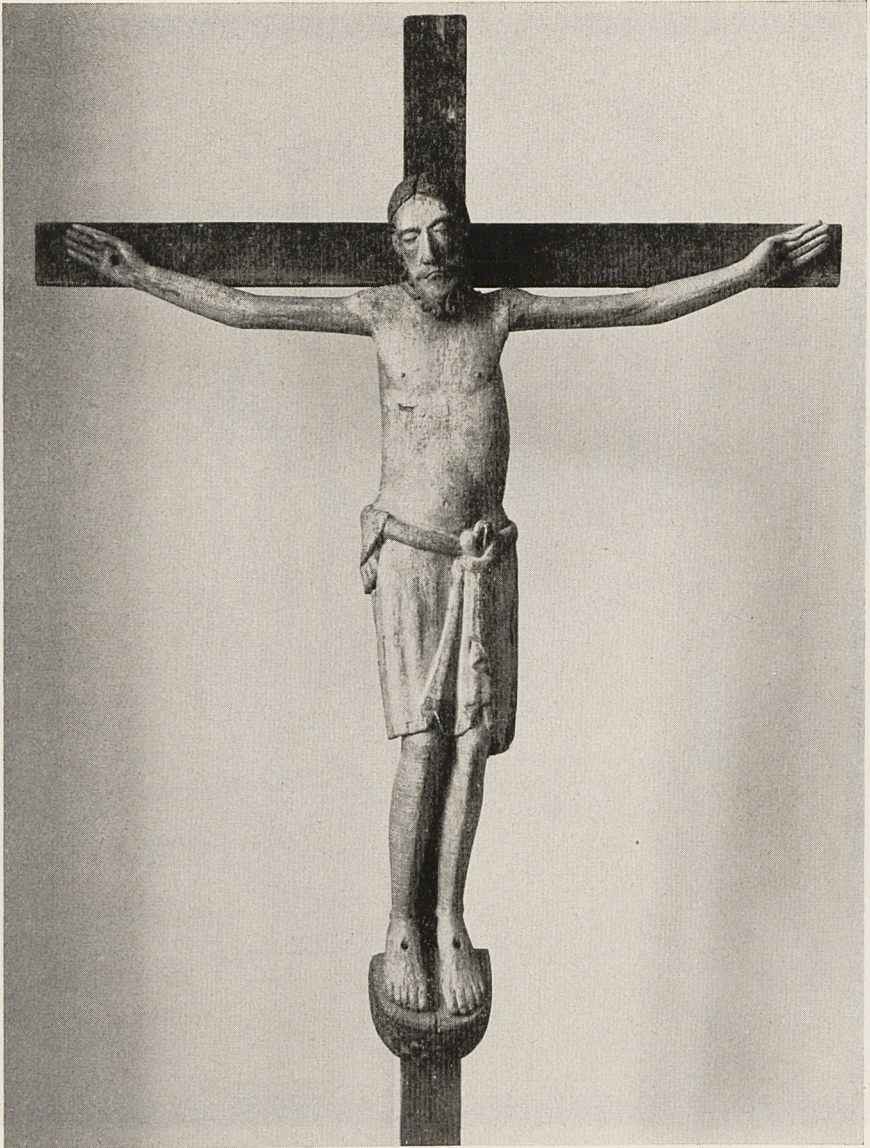
Abb. 1 Kruzifixus. Köln, Schmütgen-Museum