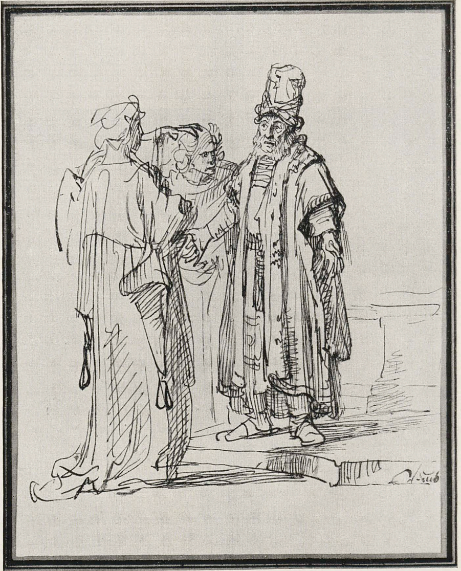
Abb. 2 Rembrandt zugeschrieben: Lot und die Engel Leipzig, Museum der Bildenden Künste