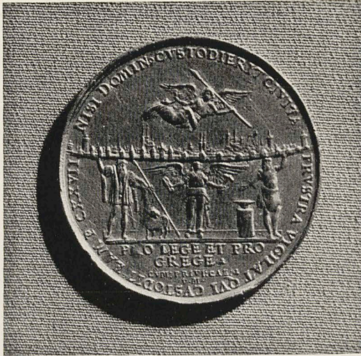
Abb. 4a Valentin Maler: Bleimedaille mit Stadtansicht von Nürnberg. 1585. Nürnberg, Germanisches National-Museum