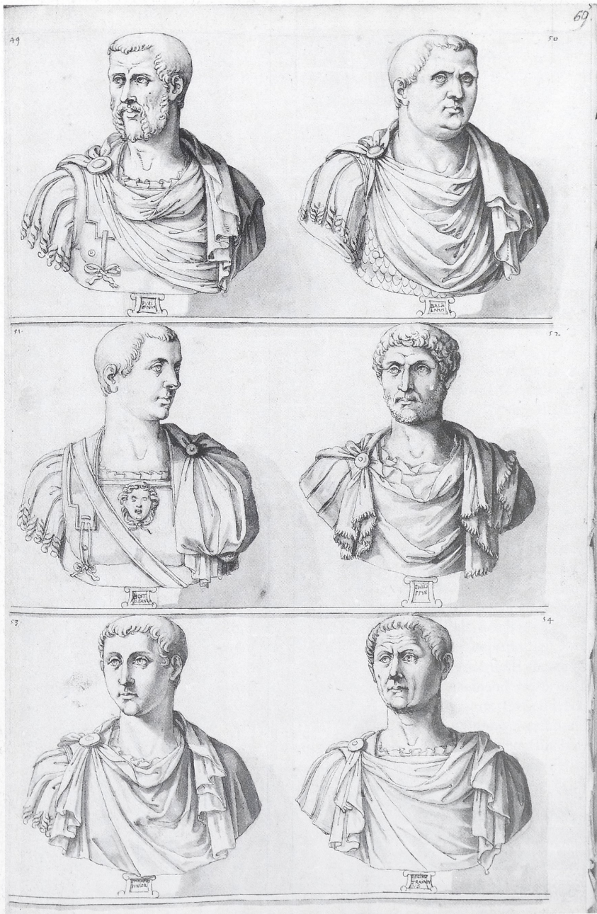
Abb. 2 und 3 Wien, Österr. Nationalbibliothek, Cod. min. 21/3, fol. 61 r und 69 r , Zeichnungen von Jacopo Strada (Bibliothek)