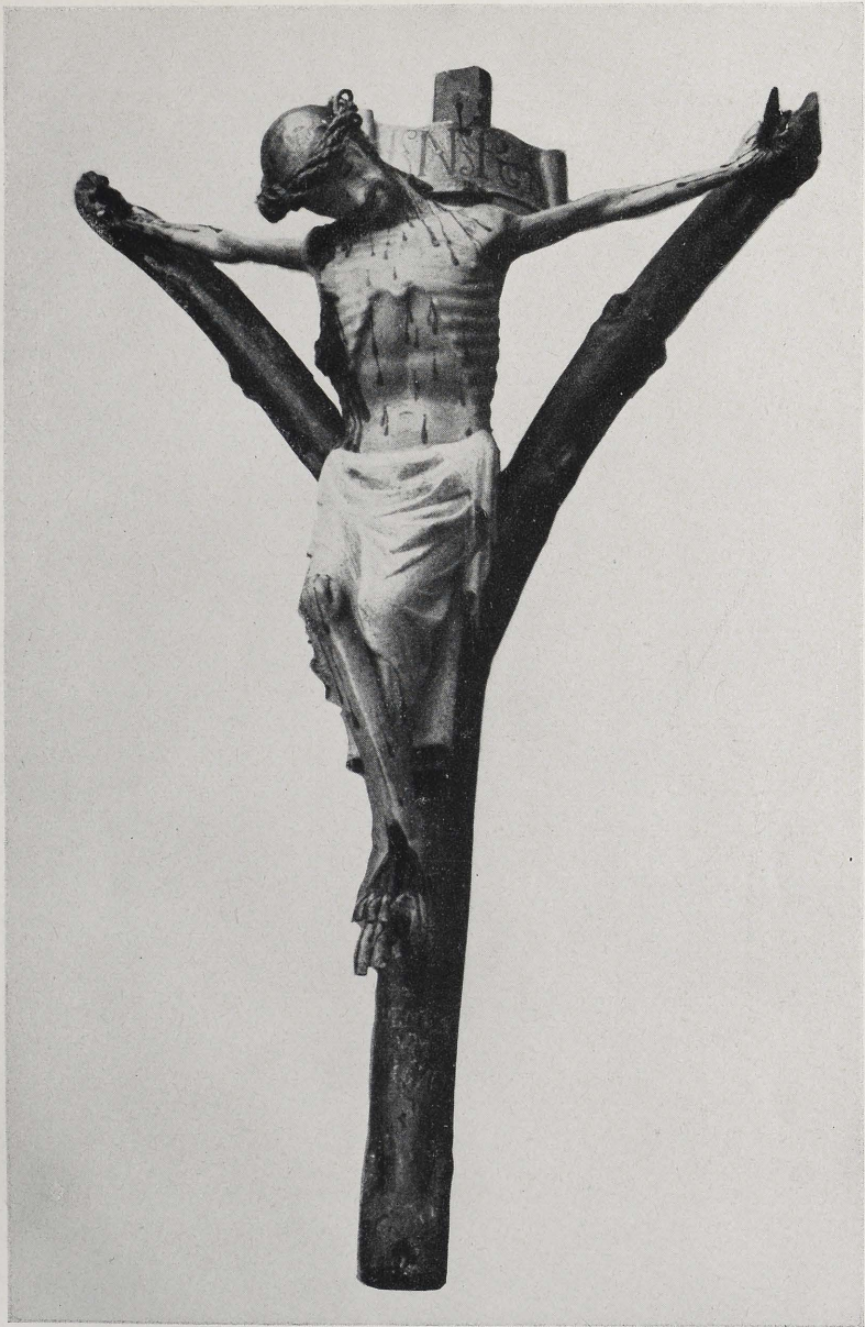
Abb. 3 Ungarn-Kreuz z. Andernach, Pfarrkirche