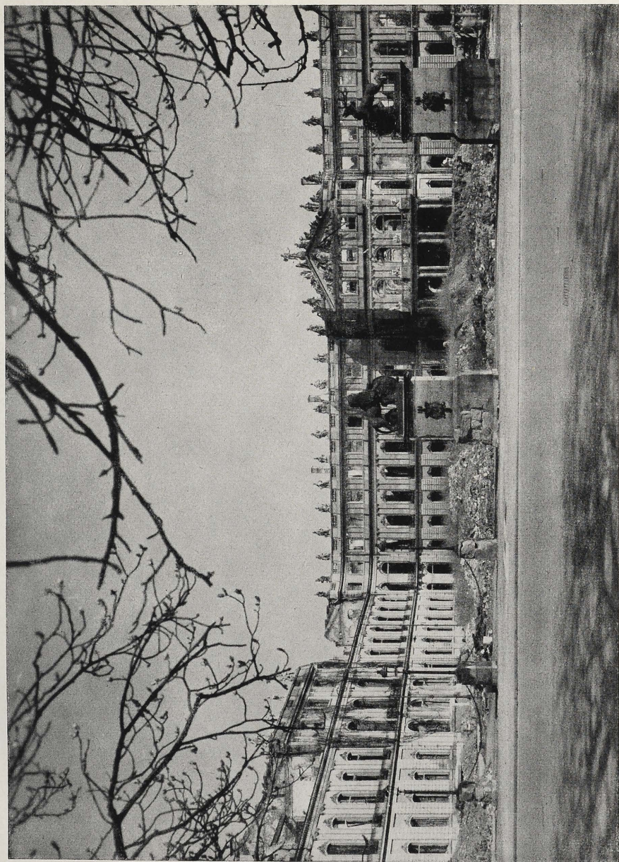
Abb. 1 Stuttgart, Neues Schloß