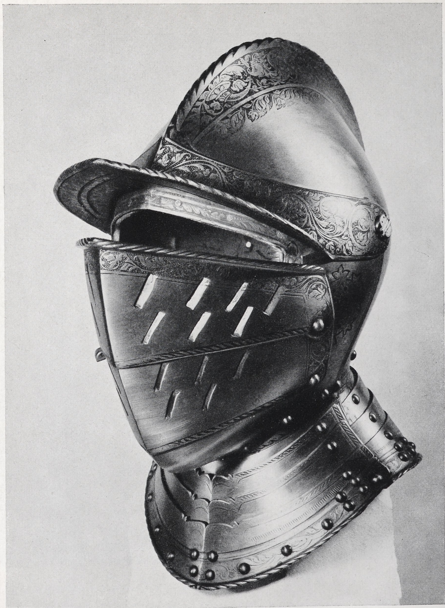
Abb. 2 Jörg Seusenhofer: Helm von einer Harnischgarnitur Kaiser Ferdinands I. Wien, Waffensammlung