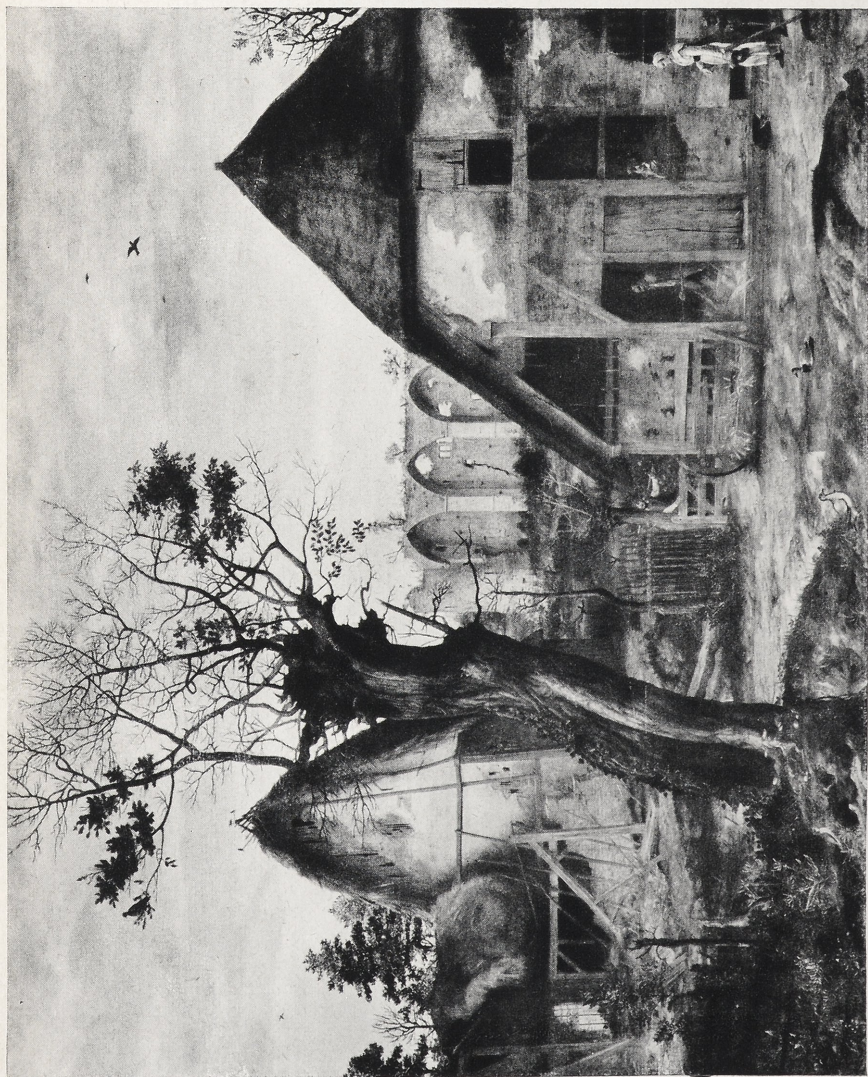
Abb. 4 Cornelis van Dalem: Geböf. München, Bayer. Staatsgemaldesammlungen (Neuerwerbung)