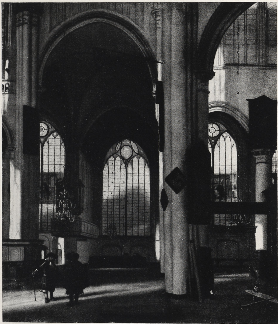
Abb. 1 Emanuel de Witte: Kirchen-Inneres. Rottach/Tegernsee, Privatbesitz