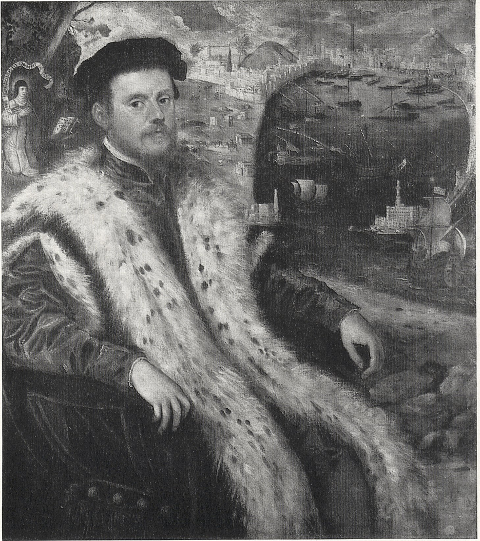
Abb. 4 Jacopo Tintoretto: Männerbildnis. Slg. Earl of Harewood.