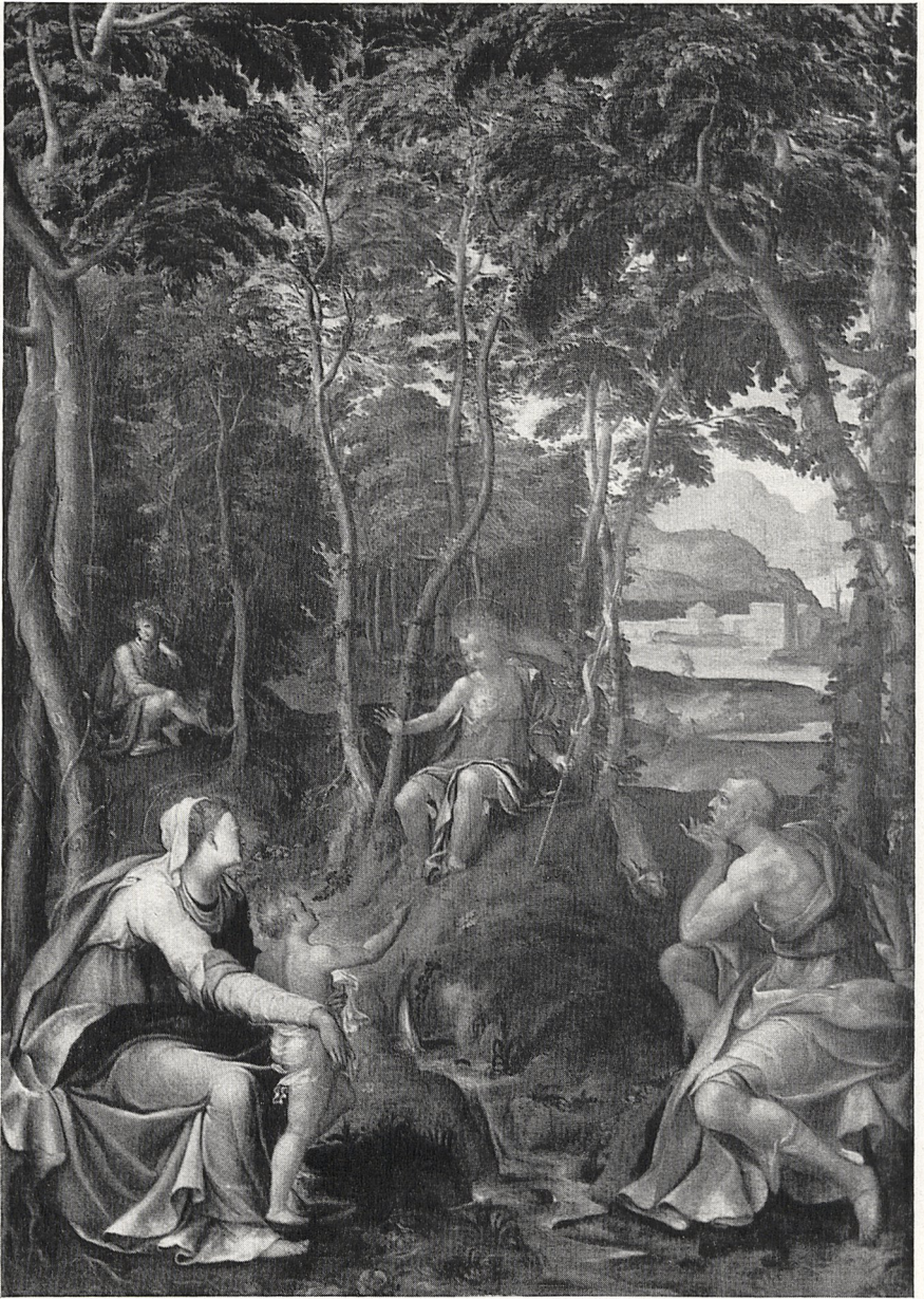
Abb. 2 Jan Soens: Die Hl. Familie mit Johannes dem Täufer. Manchester, City Art Gallery.