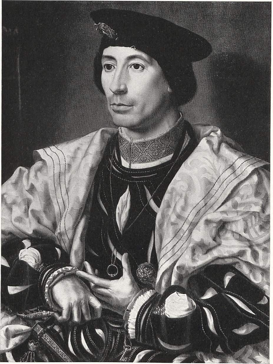
Abb. 1 Jan Gossaert: Bildnis eines Edelmannes. Berlin, Staatliche Museen