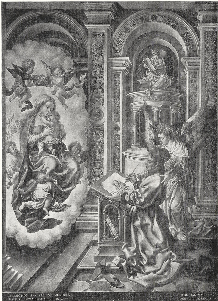
Abb. 3 Jan Gossaert: Der hl. Lukas zeichnet die Madonna. Wien, Kunsthistorisches Museum