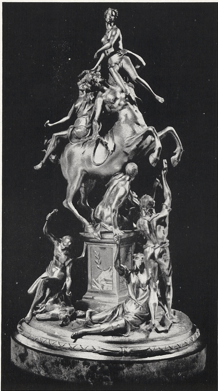
Abb. 4 Francesco Bertos: Huldigung an die Skulptur. London, Coll. P. Wallraf