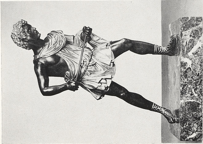
Abb. 1a Pier Jacopo Alari Bonacolsi, gen. Anitico: Meleager. London, Victoria and Albert Museum