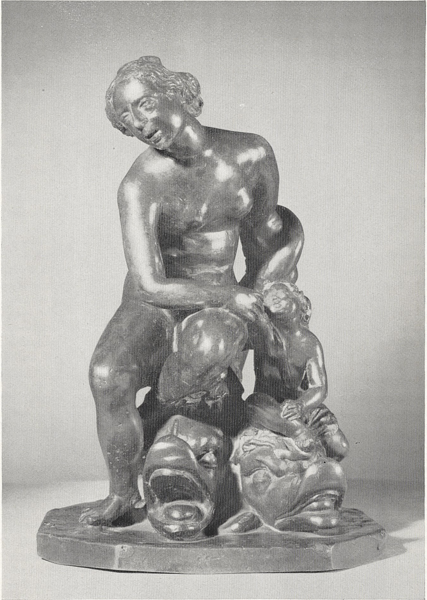
Abb. 3 Venus. Toskana, 3. Viertel 16. Jahrh. London, Victoria and Albert Museum