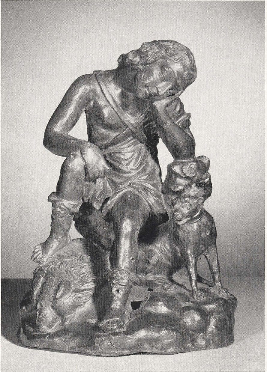
Abb. 2 Meleager. Padua, 1. Hälfte 16. Jahrh. London, Victoria and Albert Museum