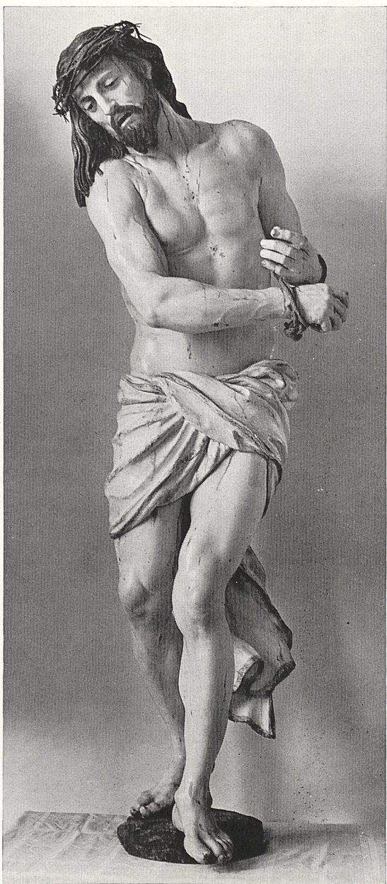
Abb. 3 Georg Petel: Ecce Homo . Augsburg, Dom