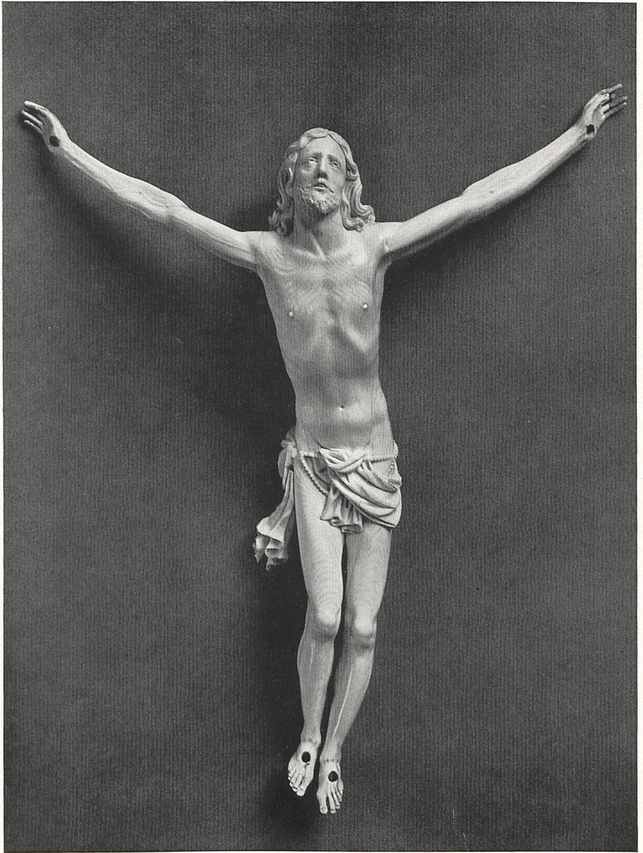
Abb. 1 Georg Petel: Elfenbeinkruzifix. München, Bayer. Nationalmuseum