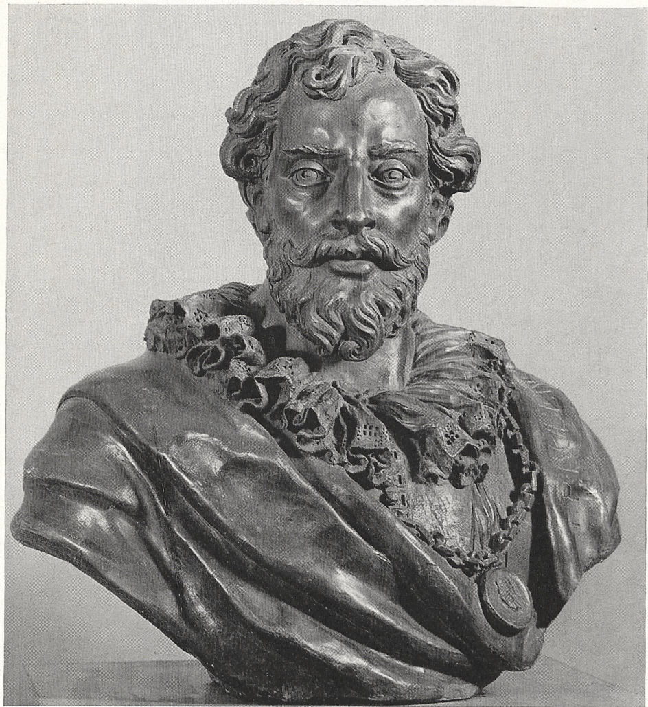
Abb. 4 Georg Petel: Bildnisbüste des Peter Paul Rubens, 1633. Antwerpen, Koninklijk Museum voor Schone Kunsten