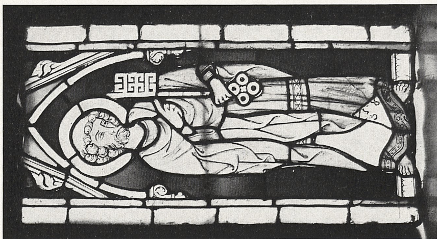
Abb. 4 a Hl. Petrus. Lye, Gotland