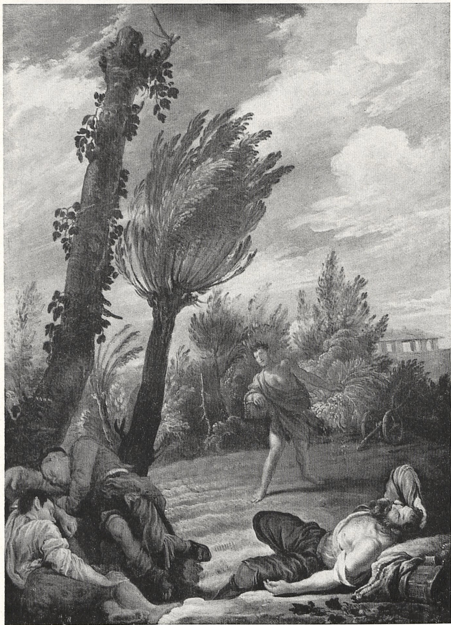
Abb. 3 Domenico Fetti: Gleichnis vom Sämner. Prag, Burg