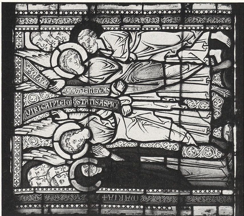
Abb. 4 b Himmelfahrt Christi. Dalhen, Gotland