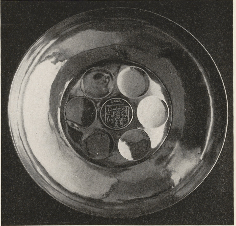
Abb. 1 Silberschale. Flämisch, letztes Viertel 15. Jahrhundert. Bern, Historisches Museum.