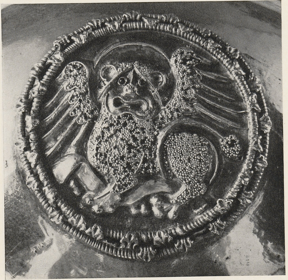
Abb. 2 Meßkelch. Süditalienisch (?), 13. Jahrh. Luzern, St. Leodegar im Hof (Ausschnitt).