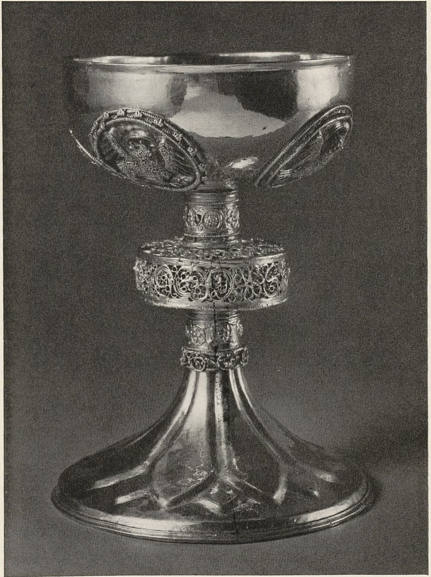
Abb. 3 Meßkelch. Süditalienisch (?), 13. Jahrhundert. Luzern, St. Leodegar im Hof.