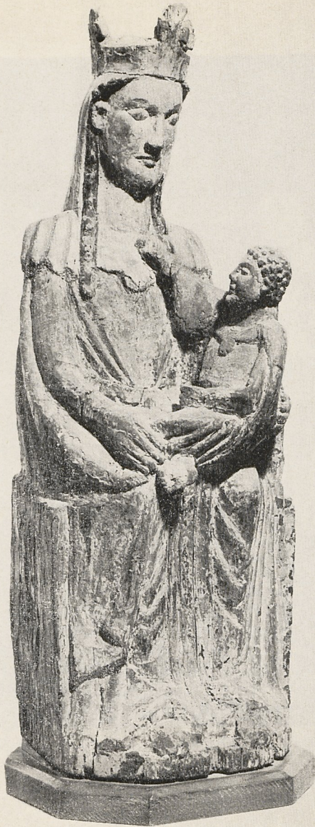
Abb. 1 Muttergottes. Westfälisch (?), um 1220. Köln, Slg. Wilhelm Hack