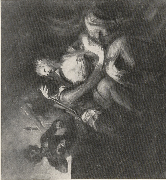
Abb. 3a Johann Heinrich Füssli: Paolo Malatesta und Francesca da Polenta, von Giunciotto Malatesta überrascht. Aarau, Aargauer Kunsthaus