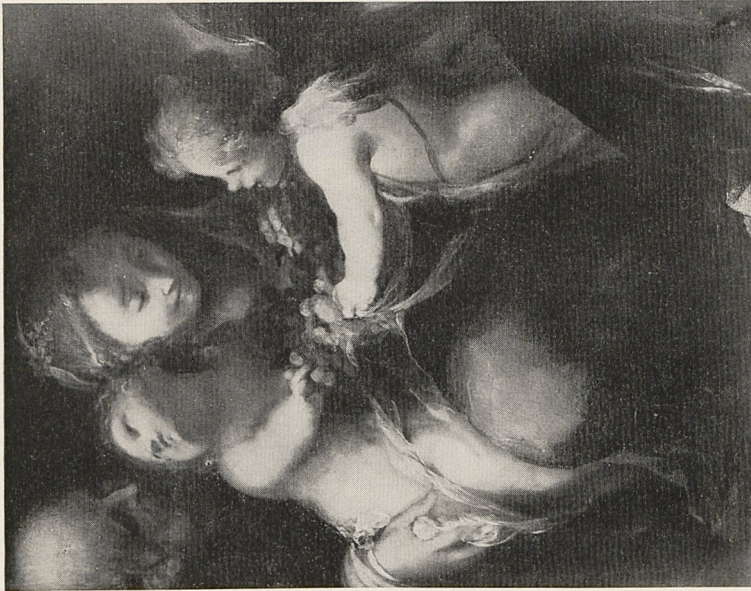
Abb. 1a Valerio Castello: Die Hl. Familie mit den Kirschen. Genua, Privatsammlung