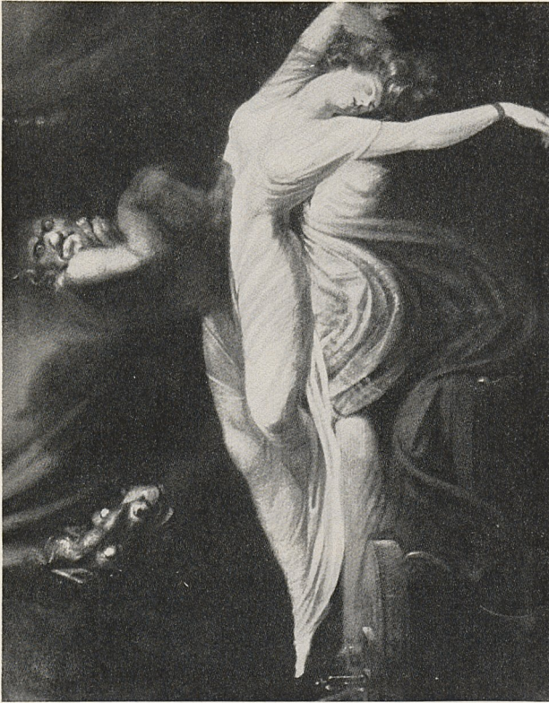
Abb. 2b Johann Heinrich Füssli: Die Nachtmahr (1781), Detroit, The Detroit Institute of Art