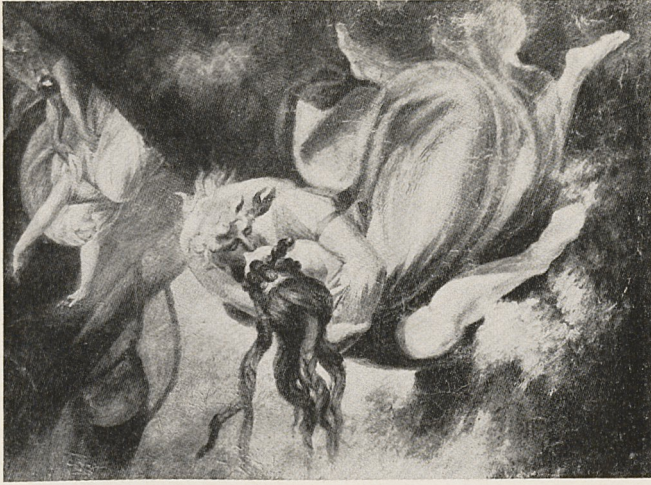
Abb. 3b Johann Heinrich Füssli: Amanda/Rezia stürzt sich mit Hüon ins Meer, Fatme wird mit Gewalt zurückgehalten. Wädenswil, Privatbesitz