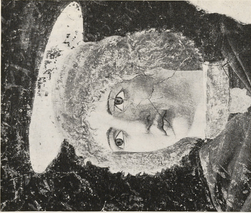
Abb. 3b Piero della Francesca: Hl. Julian (Ausschnitt). Borgo San Sepolcro, Pinacoteca