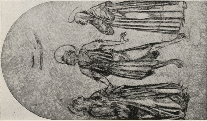
Abb. 3a Andrea del Castagno: Die Heiligen Paula, Hieronymus und Eustochium. Sinopie zum Trinitätsfresko. Florenz, SS. Annunziata