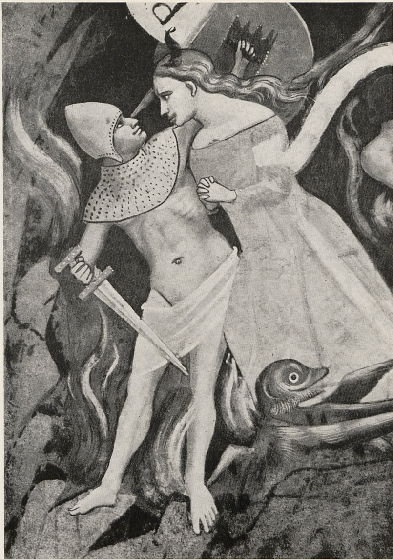
Abb. 1 Andrea Orcagna: Jüngstes Gericht. Detail der Höllendarstellung. Florenz, S. Croce