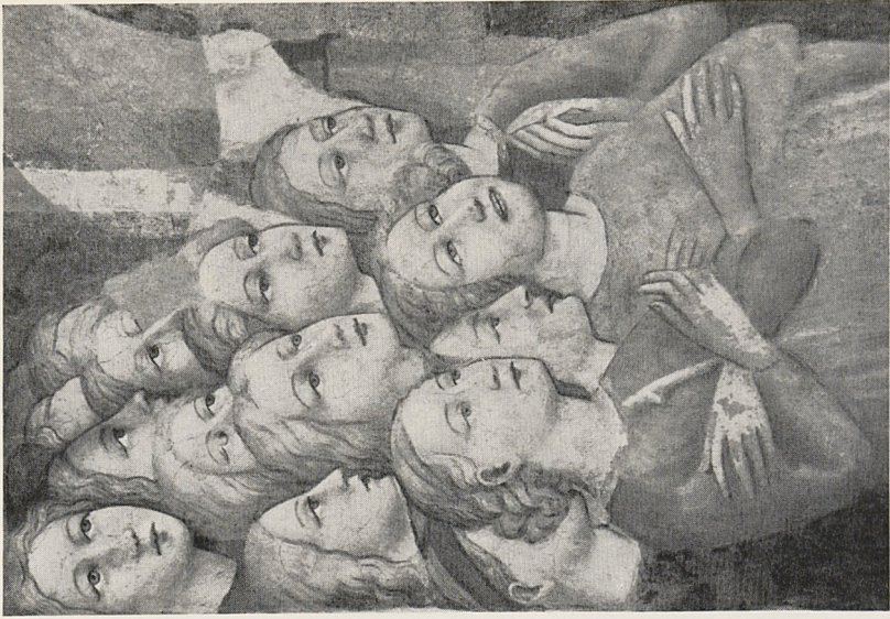
Abb. 2b Masolino: Fragment einer Szene der Kreuzlegende. Empoli, Sant'Agostino