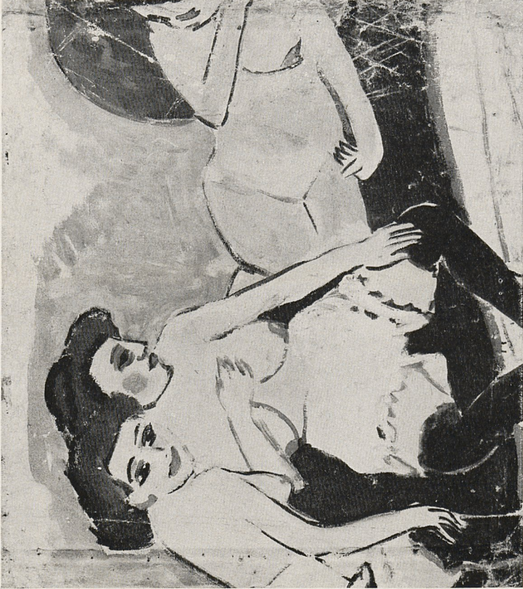
Abb. 4 E. L. Kirchner: Drei Akte auf schwarzem Sofa (um 1909/10). Chur, Kunsthau