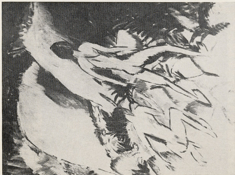
Abb. 2a E. L. Kirchner: Akte am Strand (Fehmann, um 1912). Verschollen; ehemals Besitz W. R. Valentiner