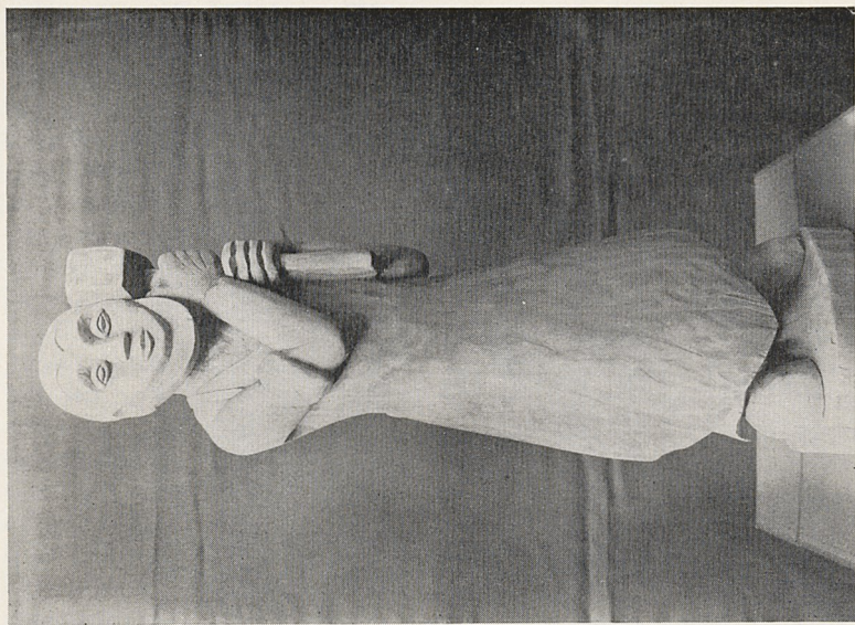
Abb. 2b E. L. Kirchner: Eisenschmied (zwischen 1914 und 1916), Entwurf für eine Kriegs-Nagelfigur; Höhe: 31 cm. Essen, Museum