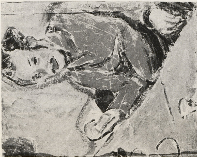
Abb. 3a E. L. Kirchner: Bildnis Erich Heckel (um 1909/10). Chur, Kunsthaus