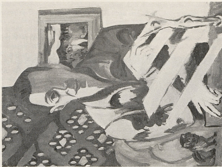
Abb. 3b E. L. Kirchner: Selbstbildnis des Künstlers. Chur, Kunsthaus