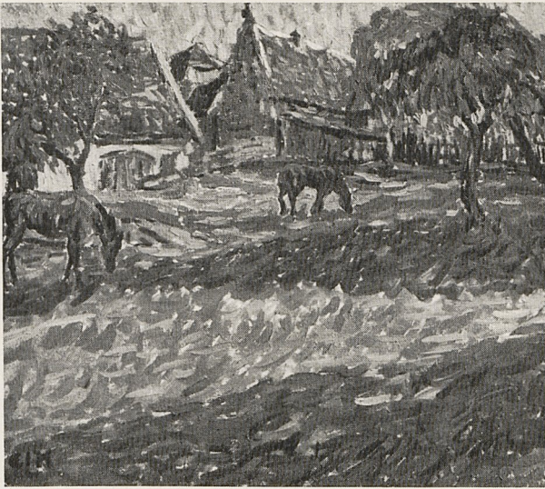
Abb. 1a E. L. Kirchner: Pferde auf der Weide (1906, vor der Übermalung). Ehemals Chemnitz, Kunstsammlung