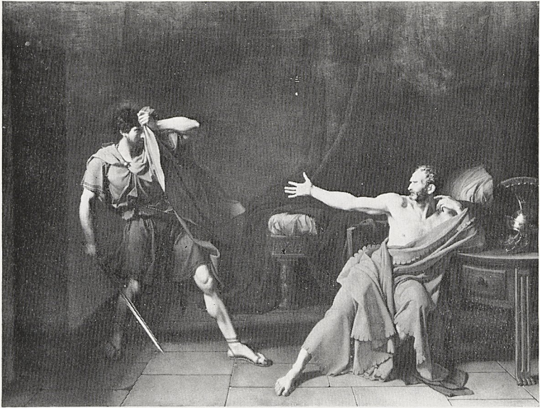
Abb. 1a Jean-Germain Drouais: Marius prisonnier à Minturnes. 1786. Paris, Louvre