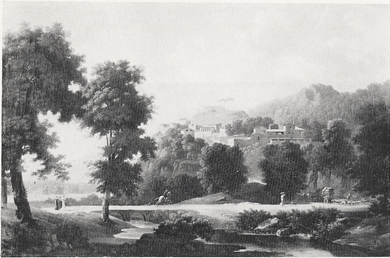
Abb. 4a Jean-Victor Bertin: Paysage d'Italie avec un cavalier. Ca. 1808—10. Boulogne-Billancourt, Bibliothèque Marmottan