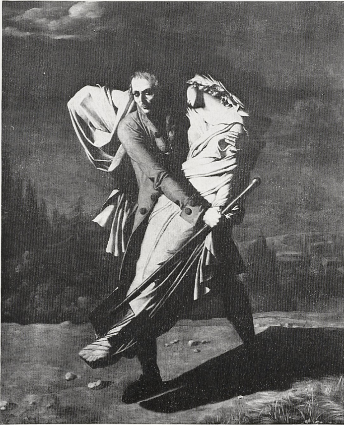
Abb. 3 Pierre-Auguste Vafflard: Young et sa fille. Salon de 1804. Angoulême, Museum