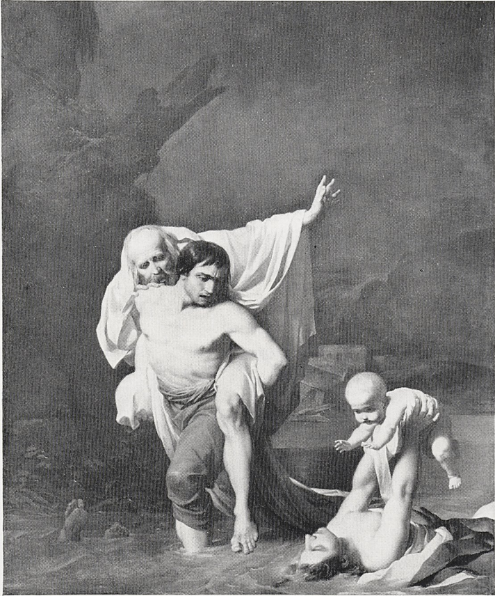
Abb. 2 Jean-Baptiste Regnault: Le déluge. Salon de 1789. Paris, Louvre