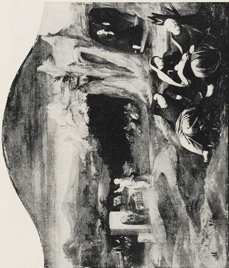
Abb. 2 Meister der weiblichen Halbfiguren: Christus am Ölberg. Köln, Wallraf-Richartz-Museum