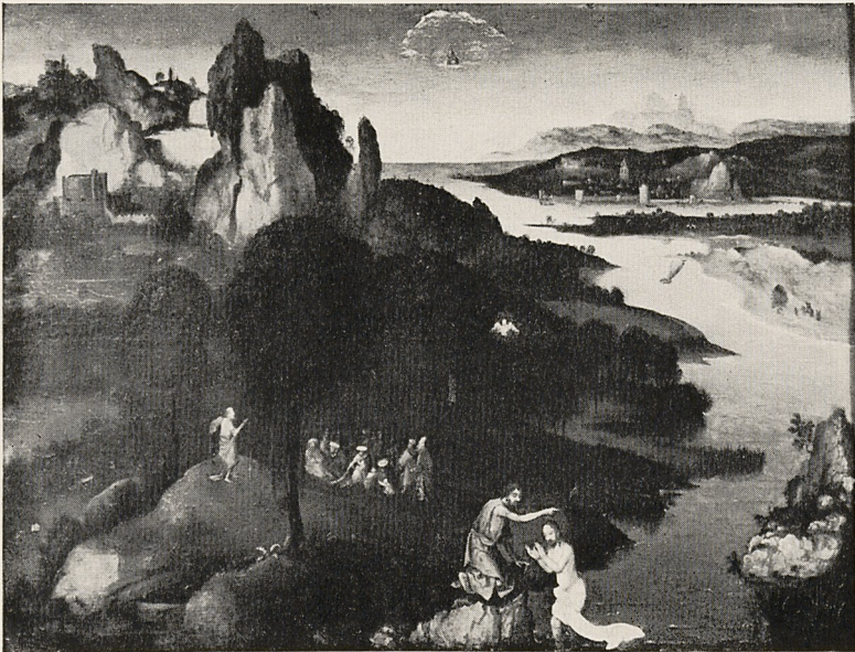
Abb. 1b Joachim Patinir (?): Landschaft mit Täuferpredigt und Taufe Christi. Zürich, Sammlung Bührle