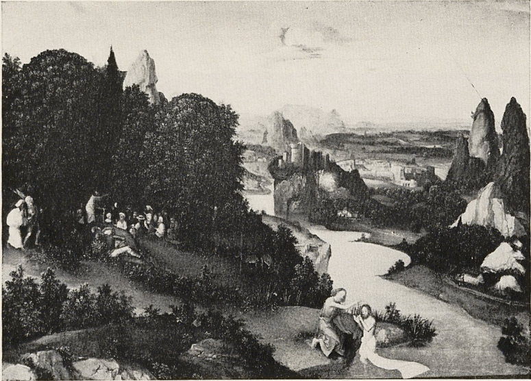
Abb. 1a Joachim Patinir: Landschaft mit Täuferpredigt und Taufe Christi. Zürich, Sammlung Bührle