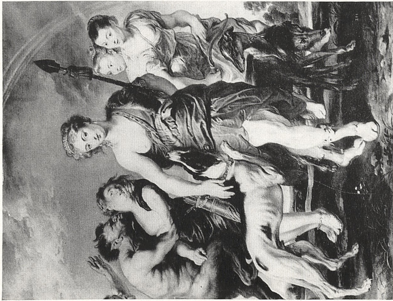
Abb. 1a Rubens (und Werkstatt?): Dianas Jagd . Sammlung Paul Getty