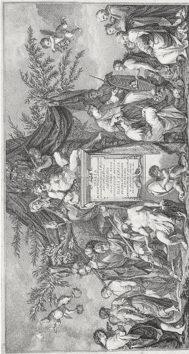
Abb. 2 Nach Giovanni da San Giovanni. Kupferstich: Allegorie der Toskana