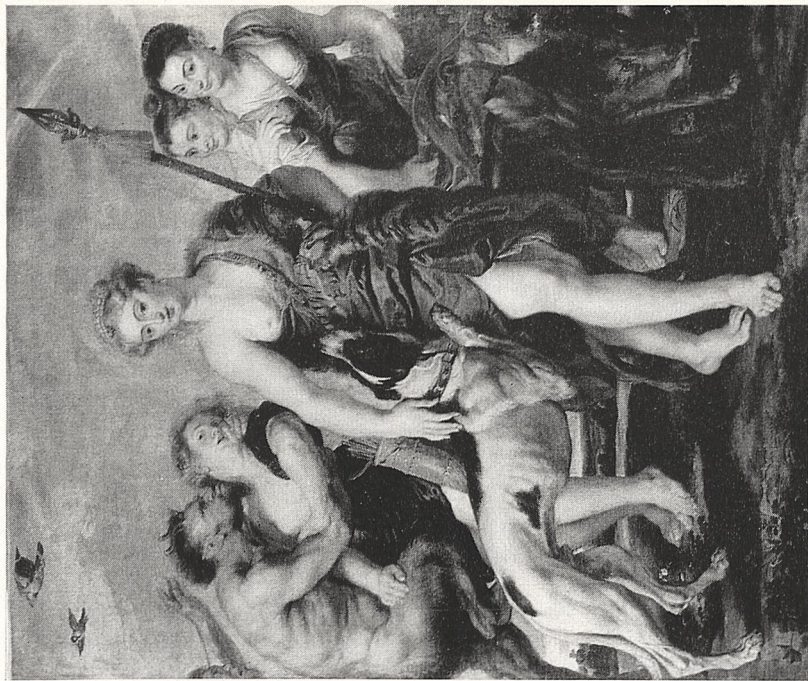
Abb. 1b Rubens (und Werkstatt?): Dianas Jagd . Cleveland (Ohio), Museum of Art