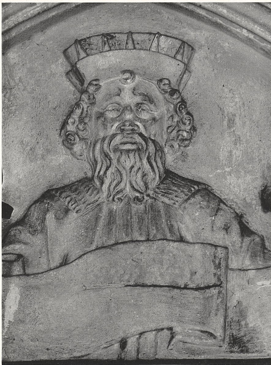
Abb. 4 Ingolstadt, Stadtpfarrkirche: Ludwig der Gebartete