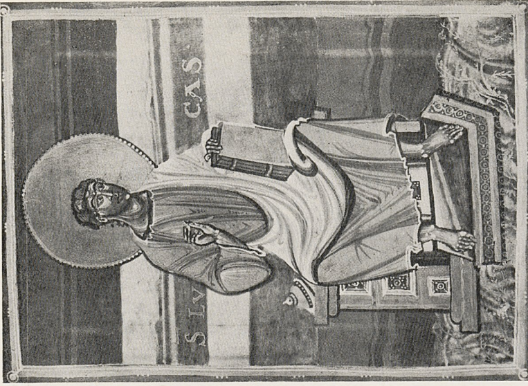
Abb. 6b Evangelist Lukas. Mailand, Bibl. Ambrosiana, C 53 Sup., fol. 118r