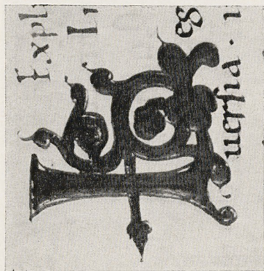
Abb. 8a Initial L. Köln, Dombibliothek, Cod. 53, fol. 125v