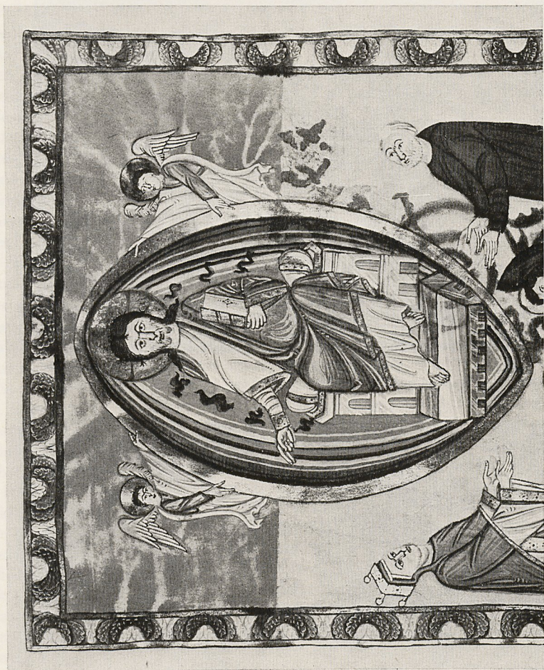
Abb. 7 Thronender Christus. Paris, Bibl. Nat. lat. 9395, fol. 15r