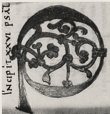
Abb. 8b Initial D. Köln, Dombibliothek, Cod. 5, fol. 35r