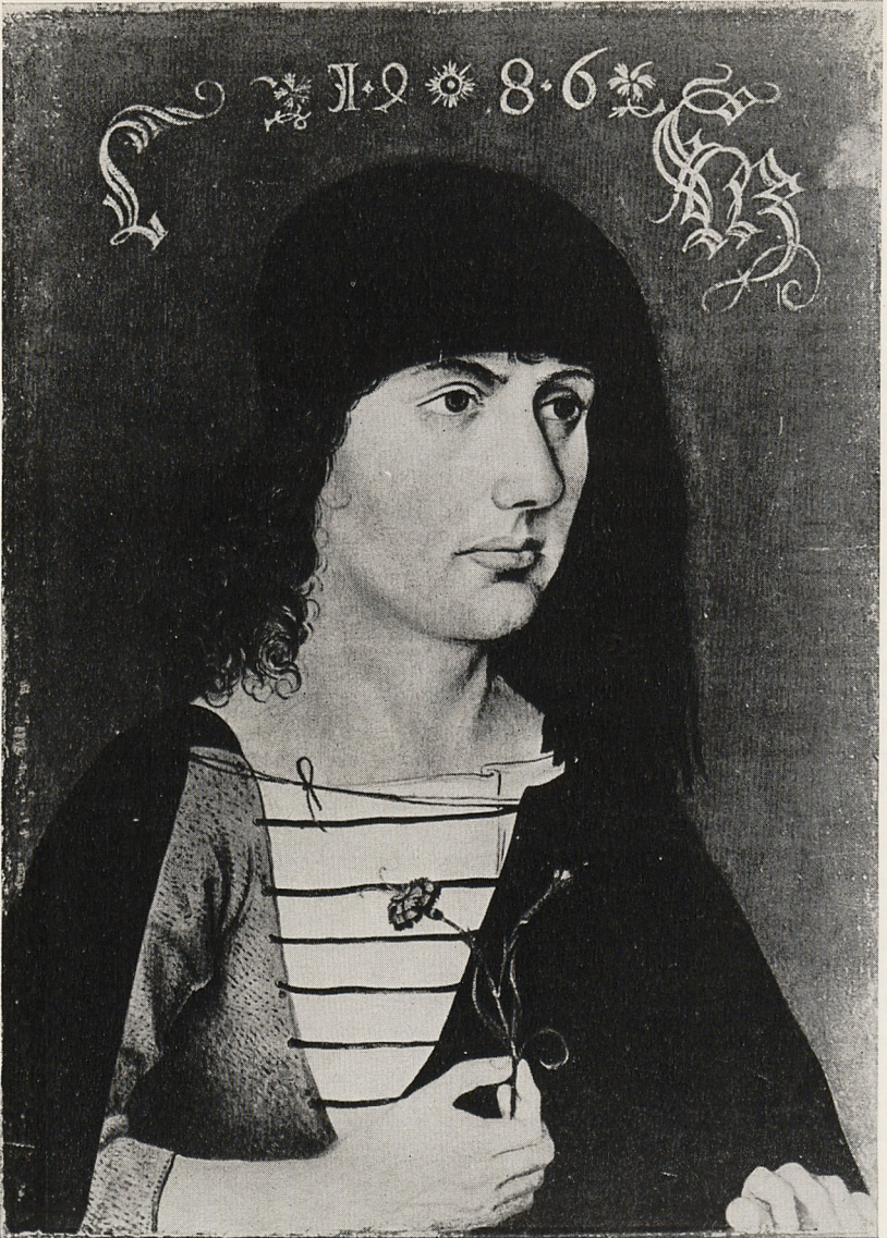
Abb. 2 Nürnbergisch (M. Wolgemut?), 1486: Bildnis eines jungen Mannes. Detroit, Institute of Fine Arts