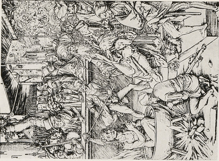
Abb. 5b Albrecht Dürer: Martyrium des Johannes aus der Apokalypse (seitenverkehrt, im Sinne der Vorzeichnung)