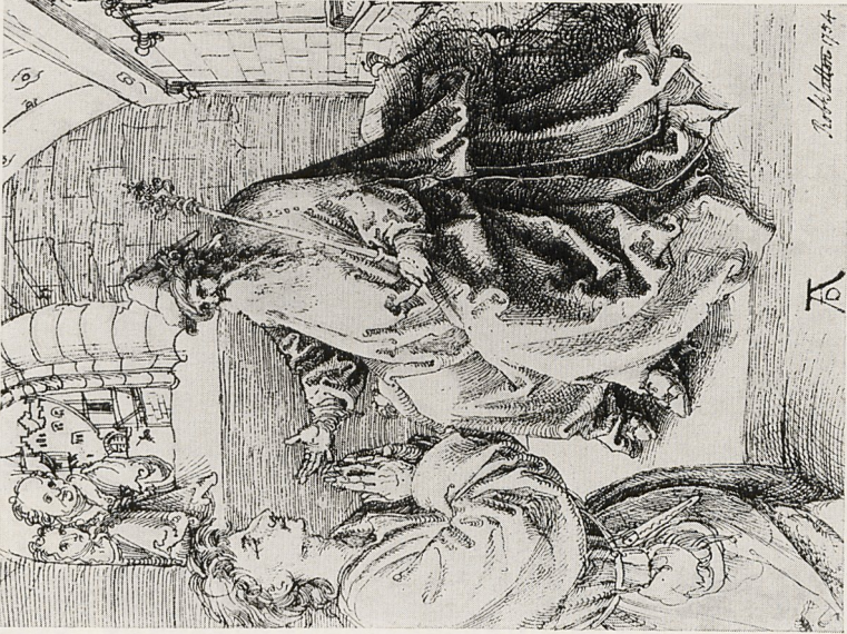
Abb. 5a Albrecht Dürer: Ungedeutete Szene. Federzeichnung. Um 1493. Oxford, The Ashmolean Museum