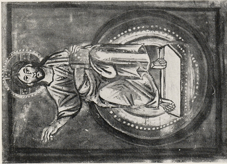
Abb. 6a Thronender Christus. St. Gallen, Stiftsbibliothek, Cod. 398, p. 4