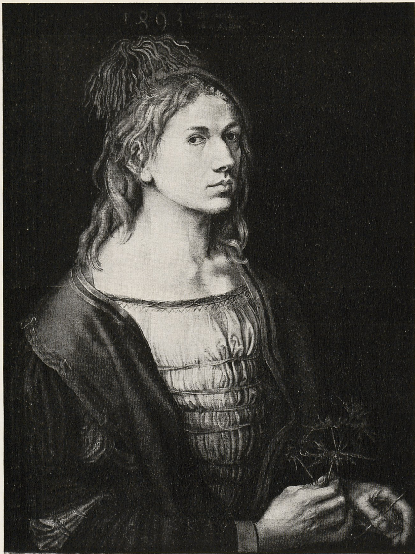
Abb. 3 Albrecht Dürer: Selbstbildnis, 1493. Paris, Louvre