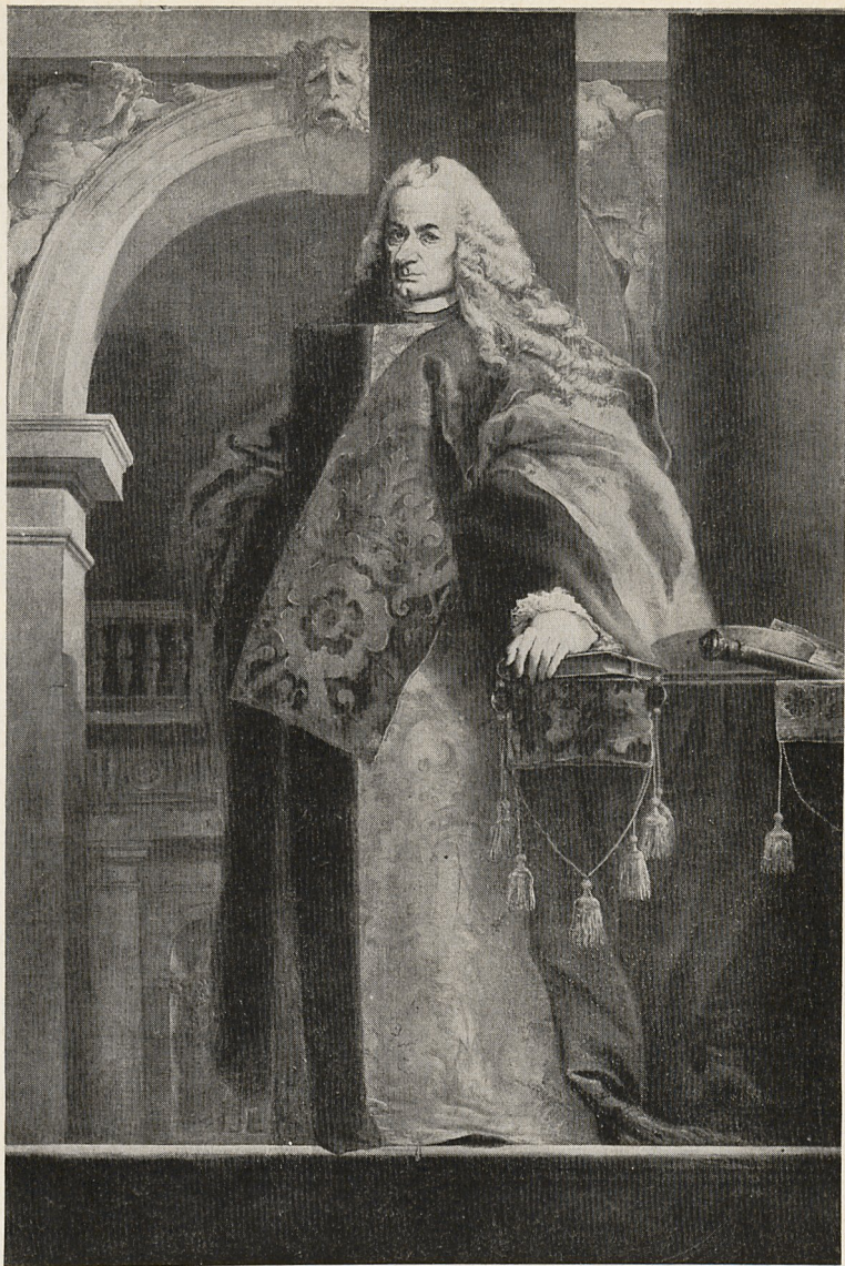
Abb. 7 Giambattista Tiepolo: Bildnis eines venezianischen Prokuratoren. Venedig, Galleria Querini-Stampalia