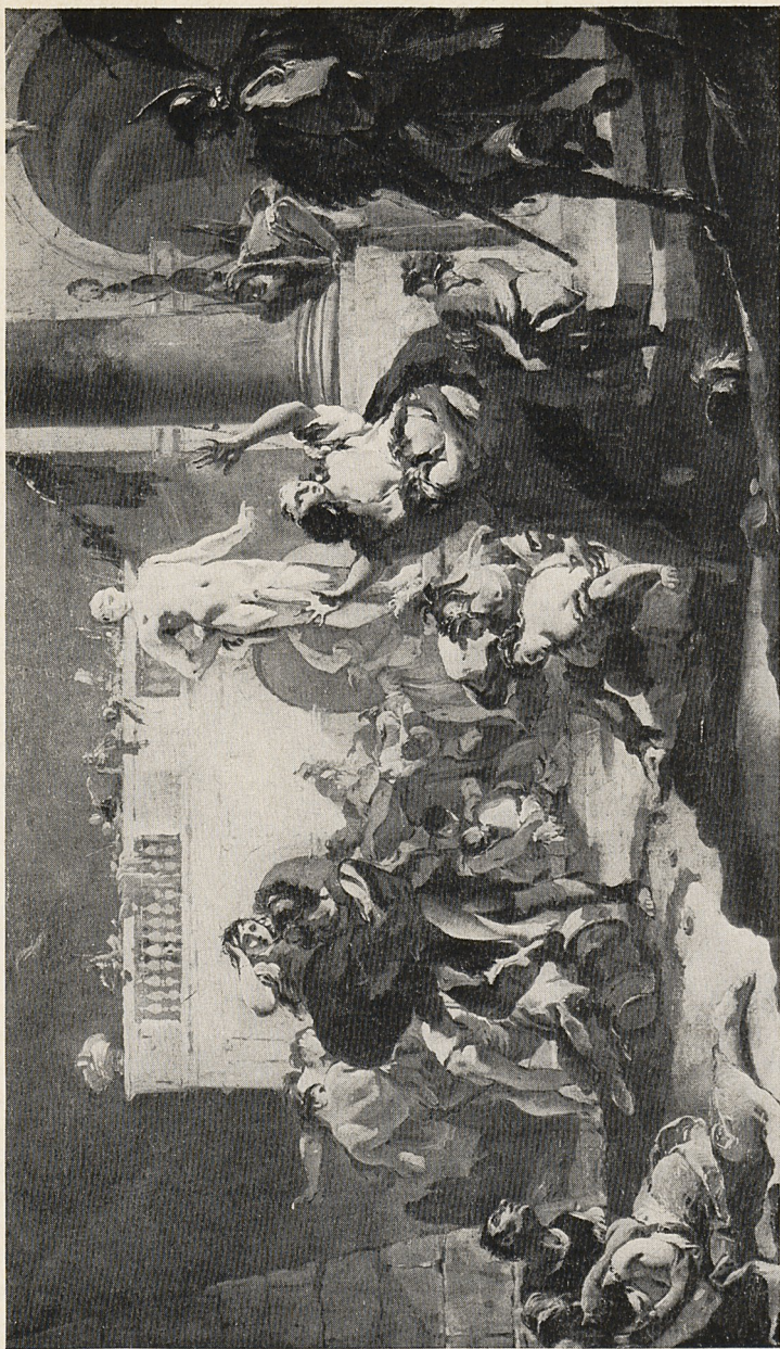
Abb. 2 Giambattista Tiepolo: Raub der Sabinerinnen. Bozzetto. Helsinki, Kunstmuseum Athenaeum