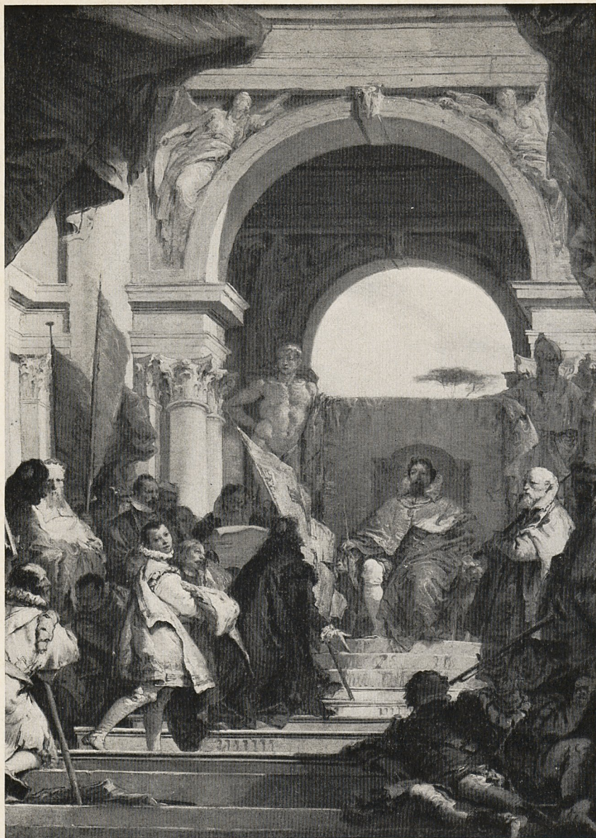
Abb. 6 Giambattista Tiepolo: Barbarossa befehlt Bischof Herold mit dem Herzogtum Franken. Bozzetto. New York, Metropolitan Museum of Art