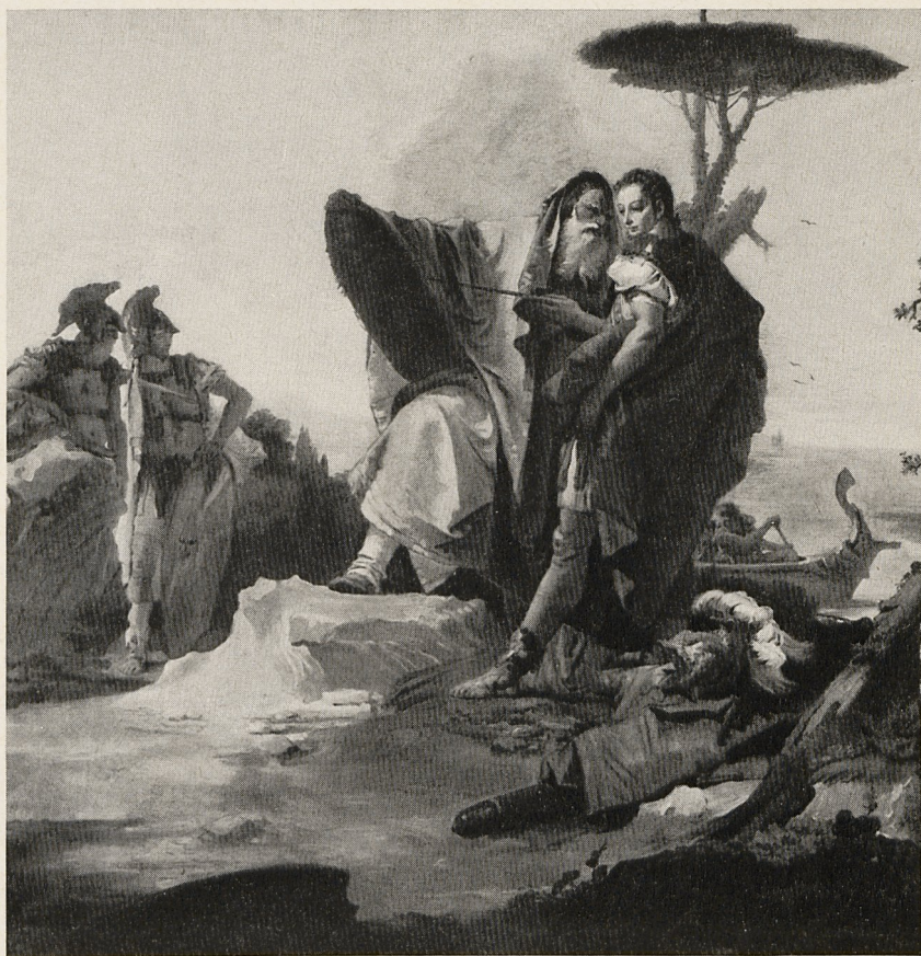
Abb. 5 Giambattista Tiepolo: Rinaldo und der Eremit. Chicago, Art Institute