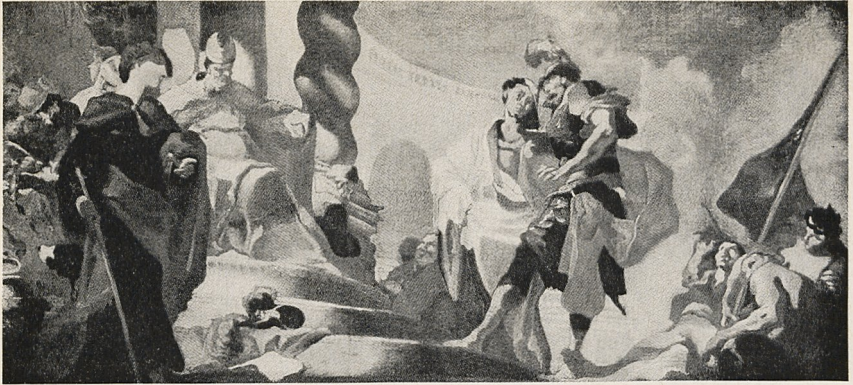
Abb. 4a Giambattista Pittoni (zugeschr.): Ungedeutete Szene. Bozzetto. Pordenone, Privatbesitz; früher London, C. Smith Collection