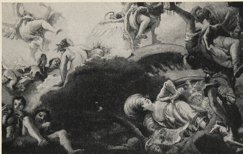
Abb. 8b Giandomenico Tiepolo: Glorie des Jacopo Giustiniani. Bozzetto für das Deckenfresko im Palazzo Ducale in Genua (Ausschn.). New York, Metropolitan Museum of Art