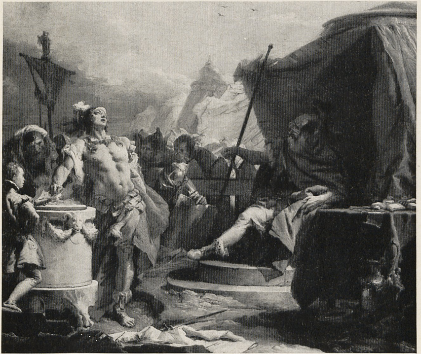
Abb. 4b Giambattista Tiepolo: Mucius Scaevola und Porsenna. Würzburg, Martin-von-Wagner-Museum