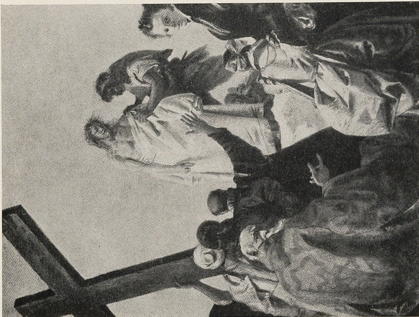
Abb. 8a Giandomenico Tiepolo: Entkleidung Christi. Kreuzwegstation. Venedig, S. Polo