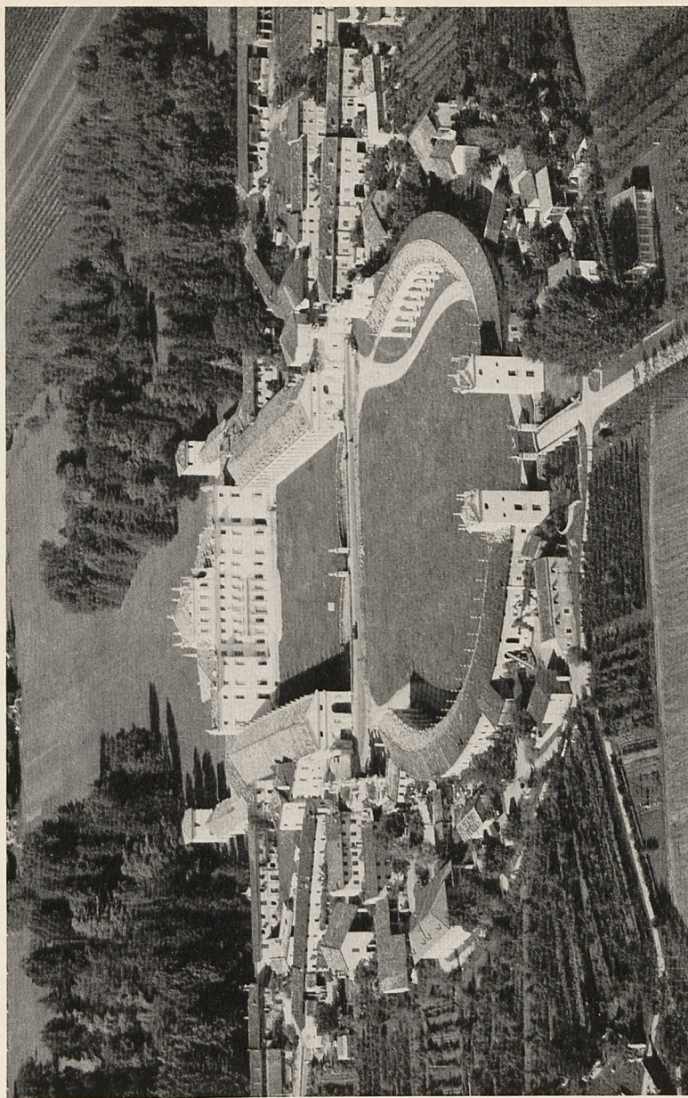
Abb. 1 Passariano bei Udine, Villa Manin. Luftbild