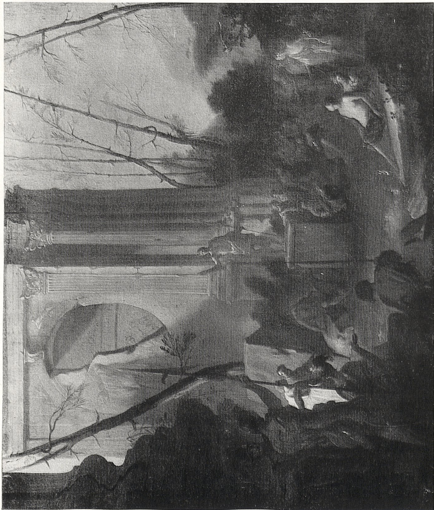
Abb. 8 Johann Heinrich Schönfeld: Predigt Johannes des Täufers. Kunsthandel