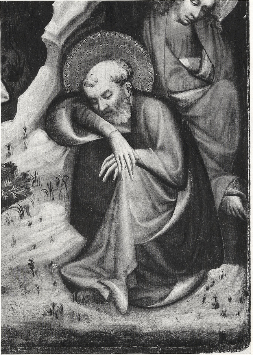
Abb. 2 Meister des Wittingauer Altares: Christus am Ölberg (Ausschnitt). Prag, Nationalgalerie