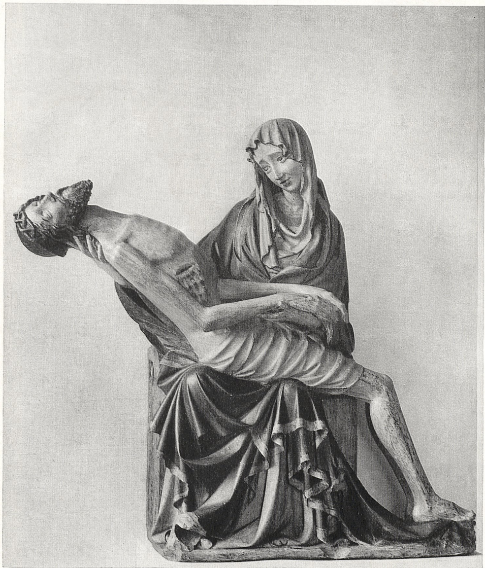
Abb. 1 Böhmisches, um 1400: Marienklage. Iglau, St. Ignatius