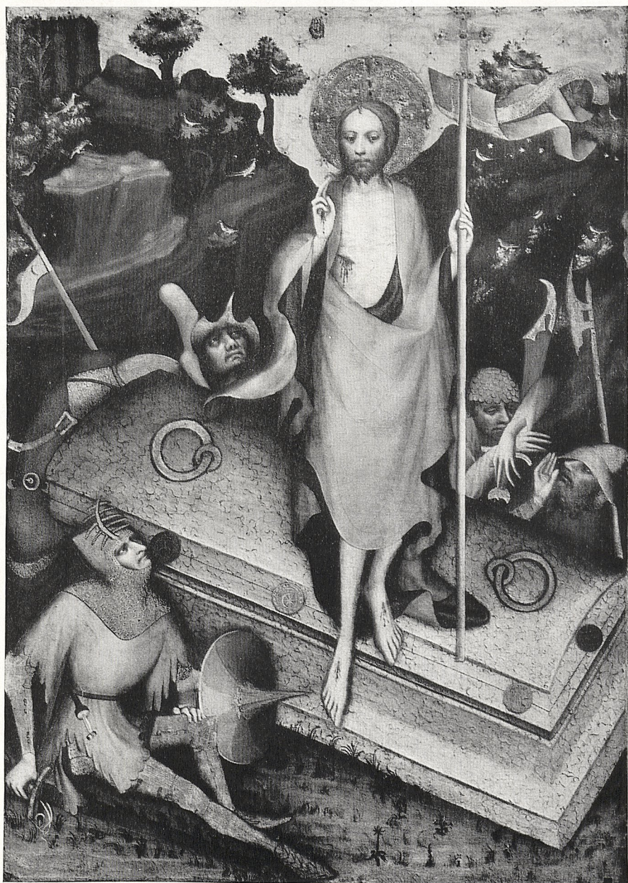
Abb. 4 Meister des Wittingauer Altares: Auferstehung Christi. Prag, Nationalgalerie