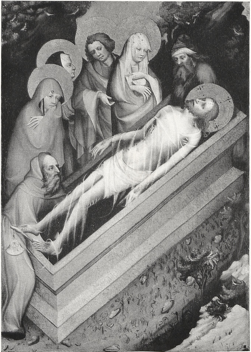
Abb. 3 Meister des Wittingauer Altares: Grablegung Christi, Prag, Nationalgalerie