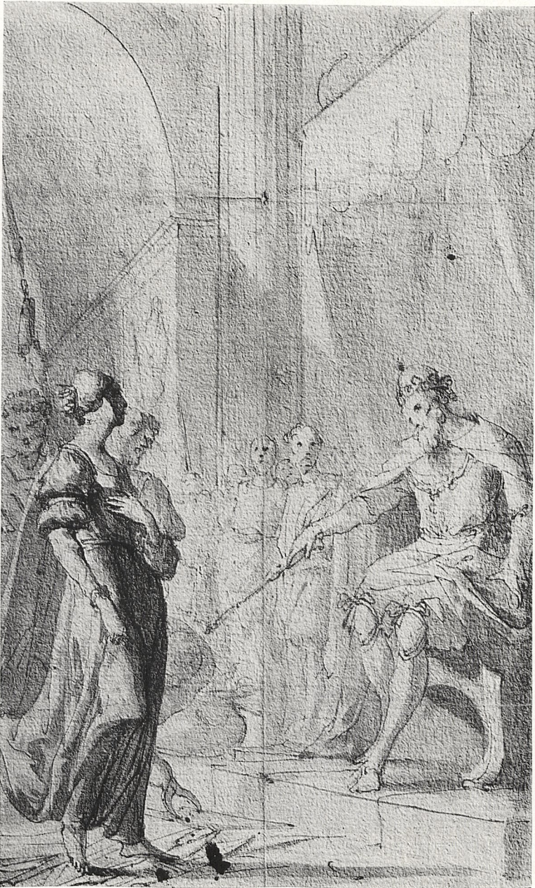
Abb.7 Johann Heinrich Schönfeld: Die heilige Kunigunde vor Kaiser Heinrich II. Stuttgart, Graphische Sammlung der Staatsgalerie (Inv. Nr. 478)