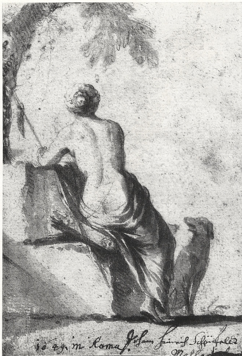
Abb. 6 Johann Heinrich Schönfeld: Studienzeichnung. München, Privatbesitz