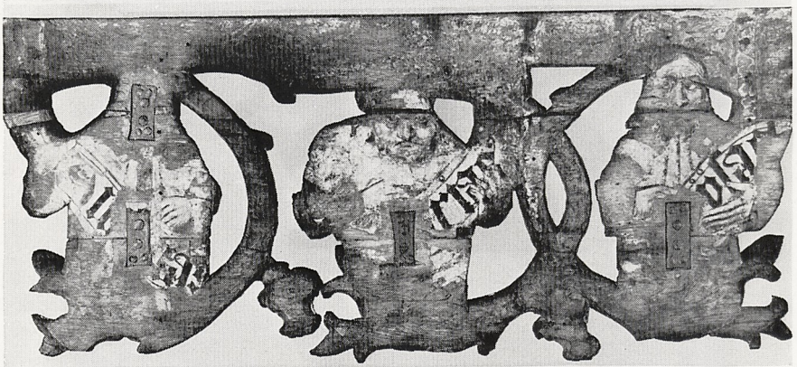
Abb. 4b Rückansicht der Dreiergruppe von Abb. 4a