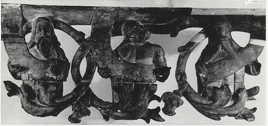
Abb. 4a Bernt Notke: Dreiergruppe von Halbfiguren unter dem linken Querbalken des Lübecker Triumphkreuzes. Vorderansicht