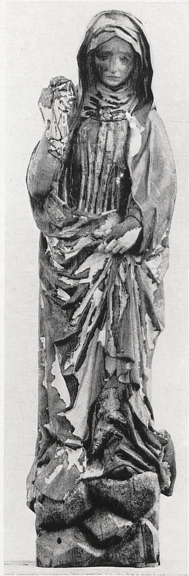
Abb. 2a+b Bernt Notke: Marienfigur vom Lübecker Triumphkreuz mit freigelegter Originalfassung. Seiten- und Vorderansicht