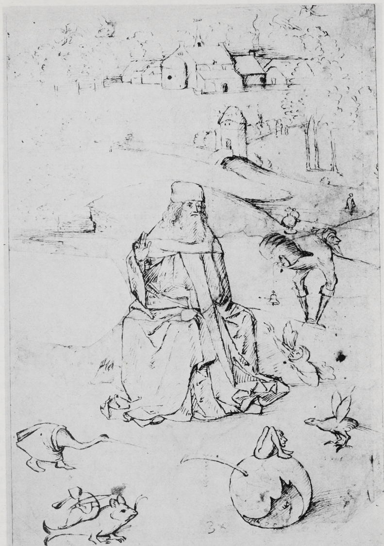
Abb. 3 Nachfolger von Hieronymus Bosch: Versuchung des Hl. Antonius, Berlin-Dahlem, Kupferstichkabinett