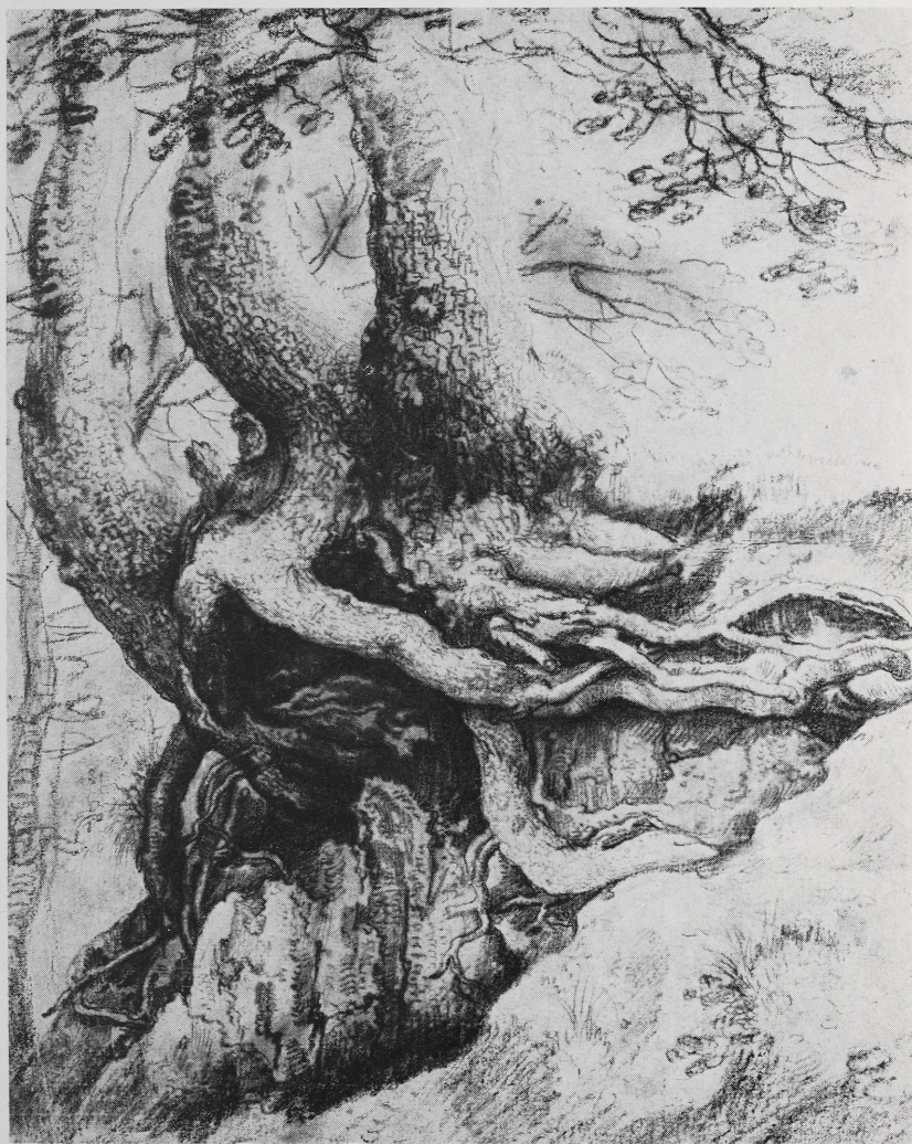
Abb. 1 Roelant Savery: Baumstudie. Um 1606—1608. Berlin-Dahlem, Kupferstichkabinett