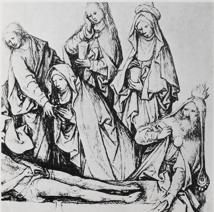
Abb. 4b Hieronymus Bosch: Grablegung. Ausschnitt. London, British Museum, Department of Prints and Drawings