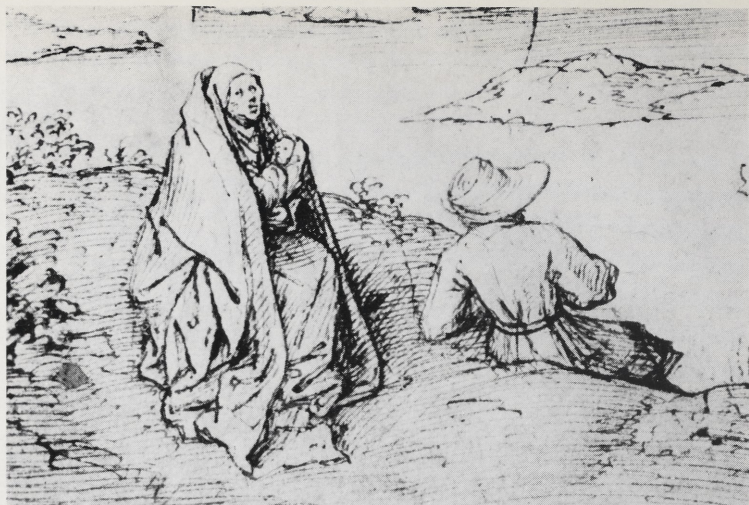
Abb. 4a Pieter Bruegel: Landschaft mit Ruhe auf der Flucht. Um 1553—1554. Ausschnitt: Hl. Familie. Berlin-Dahlem, Kupferstichkabinett