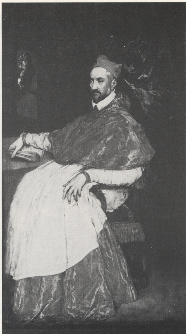
Abb. 3. El Greco: Bildnis des Kardinals Charles Guise de Lorraine. Schweiz, Privatbesitz