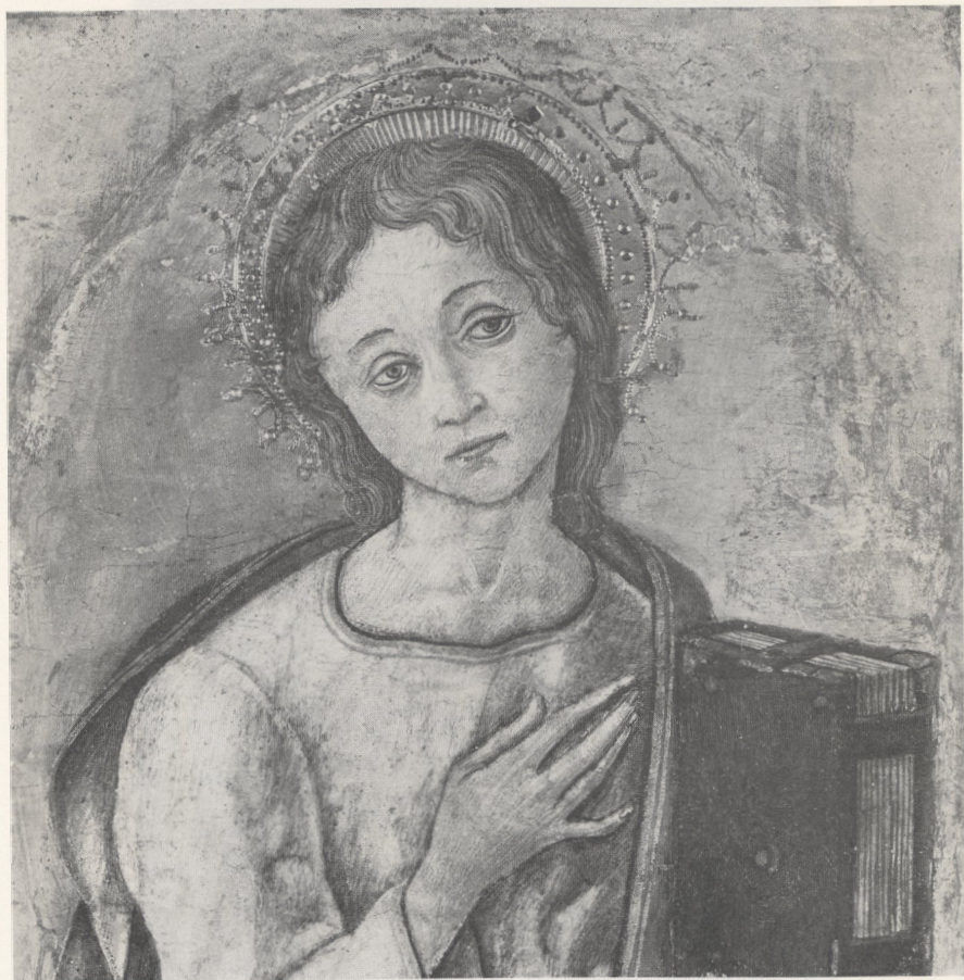
Abb. 1 Vittore Crivelli: Predellenfragment (Detail). Schweiz, Privatbesitz