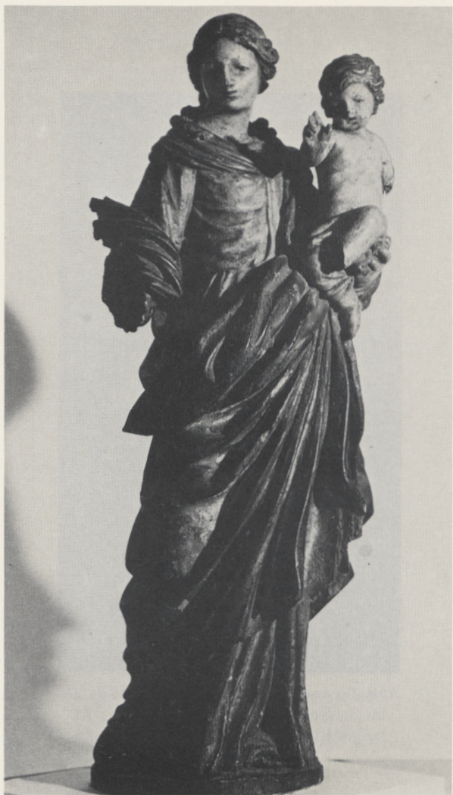
Abb. 1 Johann Wolfgang Frölicher: Madonna. Lindenholzmodell, um 1679. Trier, Städtisches Museum