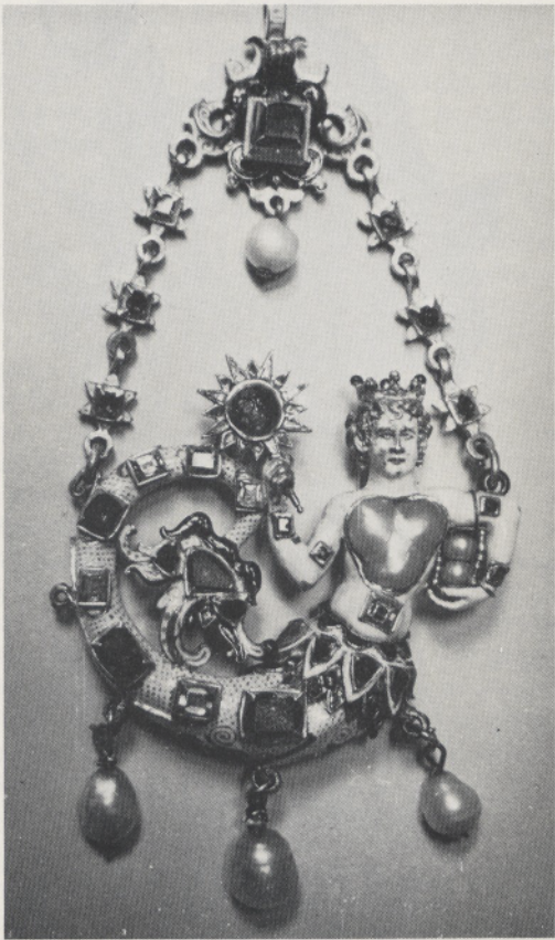
Abb. 2 Anhänger. Niederländisch, 16. Jh. Florenz, Museo degli Argenti