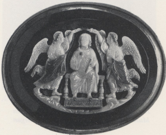
Abb. 4b Kameo „Krönung Friedrichs II. durch Victorien“. München, Staatliche Münzsammlung