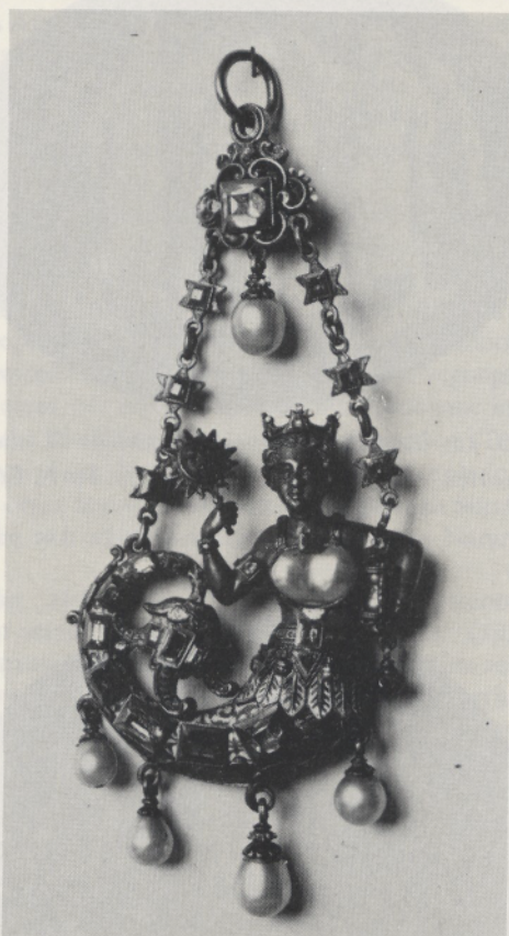
Abb. 3 Anhänger. Nachbildung des 19. Jh. (vgl. Abb. 2). New York, Metropolitan Museum of Art, Gift of J. Pierpont Morgan 1917