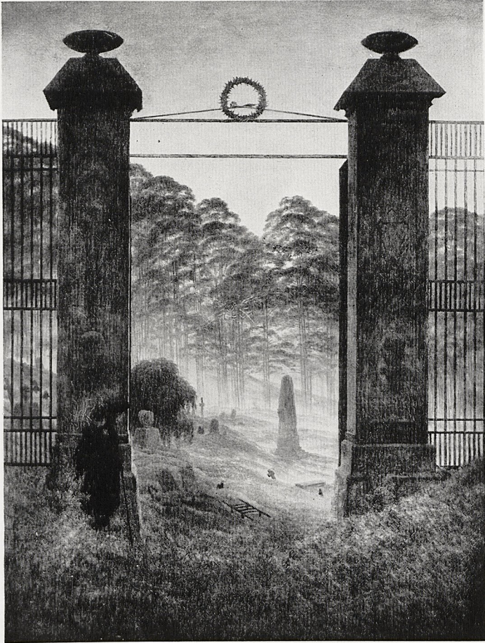
Abb. 1 Caspar David Friedrich. Friedhofstor . 1825. Dresden, Gemäldegalerie