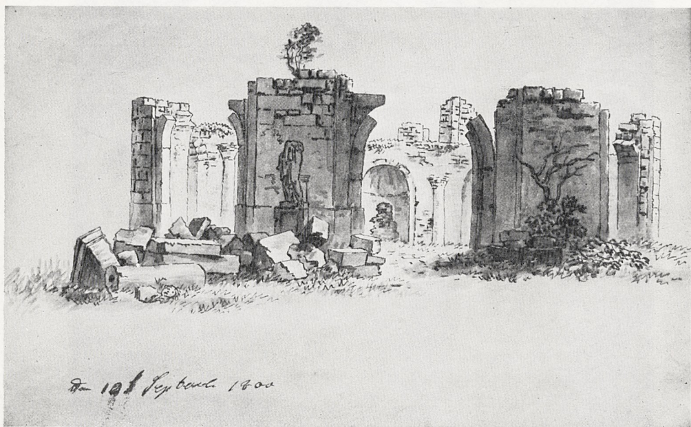
Abb. 4 Caspar David Friedrich: Ruinen. 1800 (aus dem Mannheimer Skizzenbuch). Mannheim, Kunsthalle