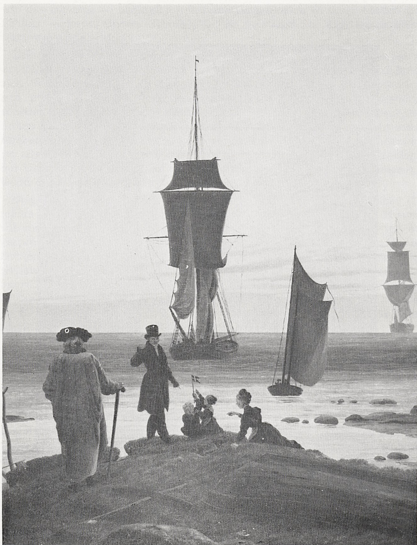
Abb. 2 Caspar David Friedrich: Die Lebensalter . Ausschnitt. Leipzig, Museum für bildende Künste