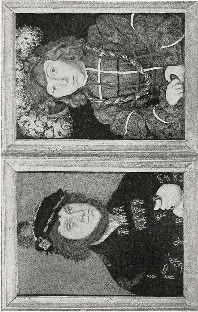
Abb. 3 Lucas Cranach d. A.: Bildnisdiptychon des Herzogs Johann von Sachsen und seines Sohnes Johann Friedrich. Privatbesitz