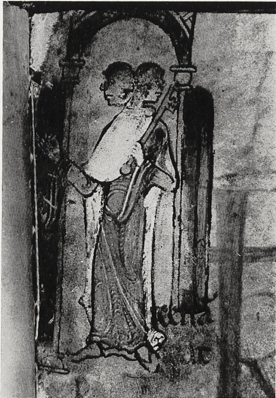
Abb. 4 Winchester Psalter: Kalenderbild für Januar. London, The British Library, Cotton MS. Nero C IV, fol. 40r