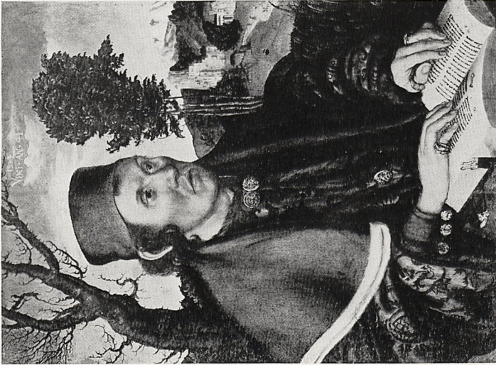
Abb. 2a Lucas Cranach d. Ä., Bildnis eines Juristen. 1503. Nürnberg, Germanisches Nationalmuseum