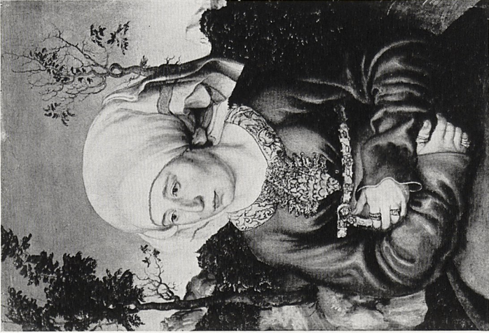
Abb. 2b Lucas Cranach d. Ä., Bildnis der Frau eines Juristen. Pendant zu Abb. 2a. Berlin, Staatliche Museen Preussischer Kulturbesitz, Gemäldegalerie