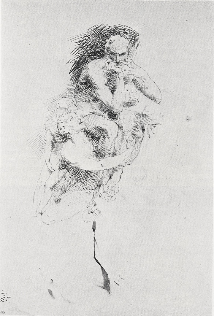
Abb. 2 J.-B. Carpeaux: Ugolino und seine Söhne. Federzeichnung, 1859/61. Paris, Louvre