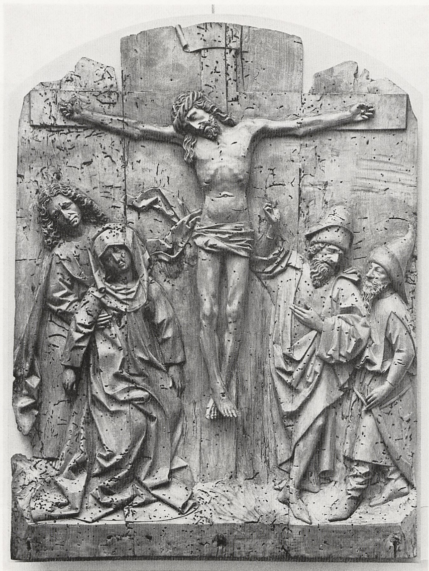
Abb. 1 Erasmus Grasser-Werkstatt: Kreuzigungsrelief. Freising, Diözesanmuseum.