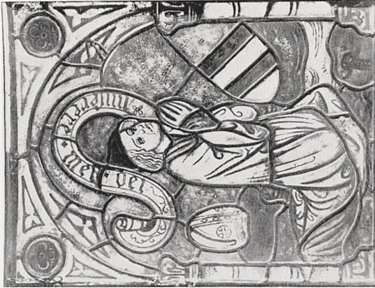
Abb. 4c Prag, Kunstgewerbemuseum. Scheibe mit knieendem Stifter.