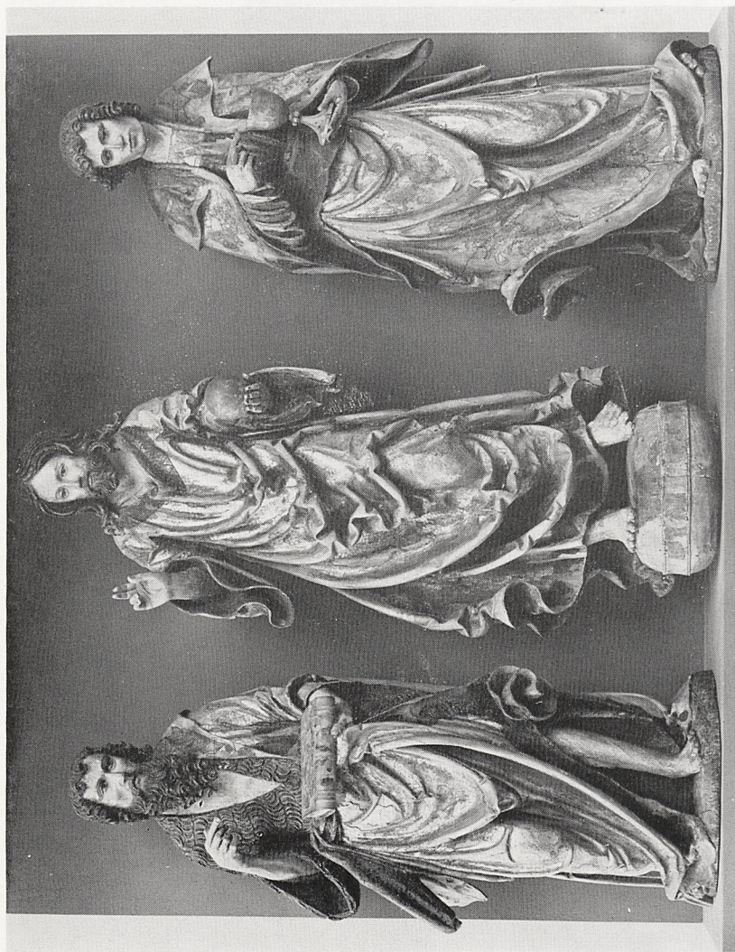
Abb. 2 Leinberger-Werkstatt: Marienod, Relief aus Emertsham/Oberbayern. Freising, Diözesanmuseum.