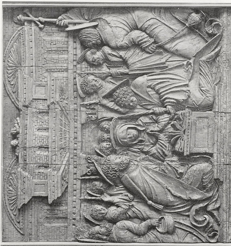
Abb. 3 Meister der Altöttinger Türen (zugeschr.): Johannes d. T., Salvator Mundi, Johannes d. Evang., Scheinfiguren aus Salmannskirchen bei Mühl- dorf/Inn. Freising, Diözesanmuseum.