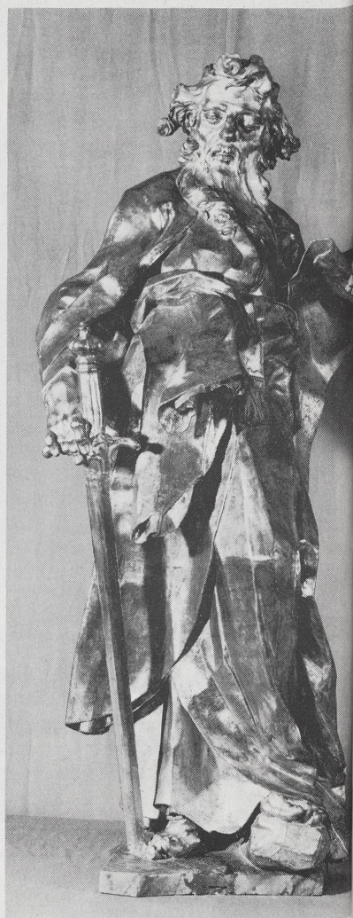
Abb. 2 Johann Paul Egell, Die Heiligen Petrus und Paulus vom Hochaltar der Pfarrkirche zu Ringing 1736 (Bad. Landesmuseum Karlsruhe, Bildarchiv 8975/8980)