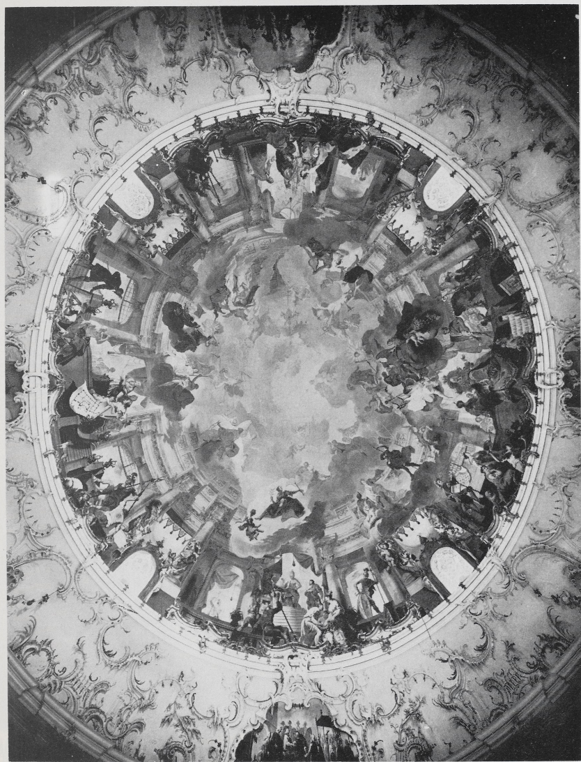
Abb. 1 Ehem. Schloß Bruchsal, Deckenbild des Stiegensaales von Joh. Zick, 1752. Vorkriegsaufnahme