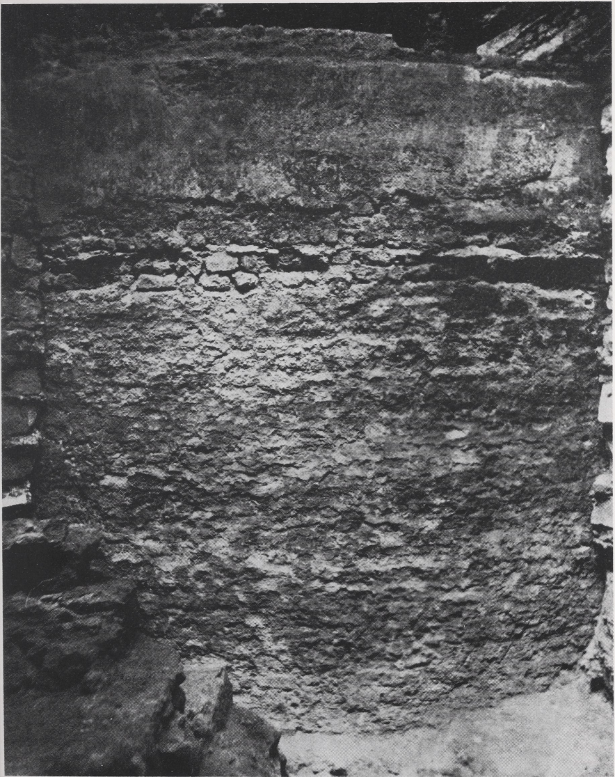
Abb. 3 Kölner Dom, Blick von Osten gegen das Fundament der Ostapsis des alten Domes (Periode VII). Die unteren zwei Drittel des Mauerwerkes gehören zu Periode VIIa, das obere Drittel ist Periode VIIb zuzuweisen. Die untersten Steinlagen von VIIb sind stark ausgewittert und an ihrer Oberkante mit einem Mörtelwulst abgedichtet. Das gesamte Mauerwerk scheint trotz Periodenteilung recht einheitlich und spricht damit eher für eine kurze Bauzeit (Doppelfeld/Weyres Abb. S. 43)