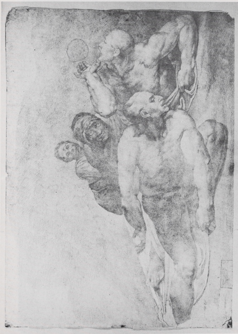
Abb. 6 Giuseppe Bossi, Kopie nach Michelangelo. Mailand, Castello Sforzesco (Civiche Raccolte d'Arte)