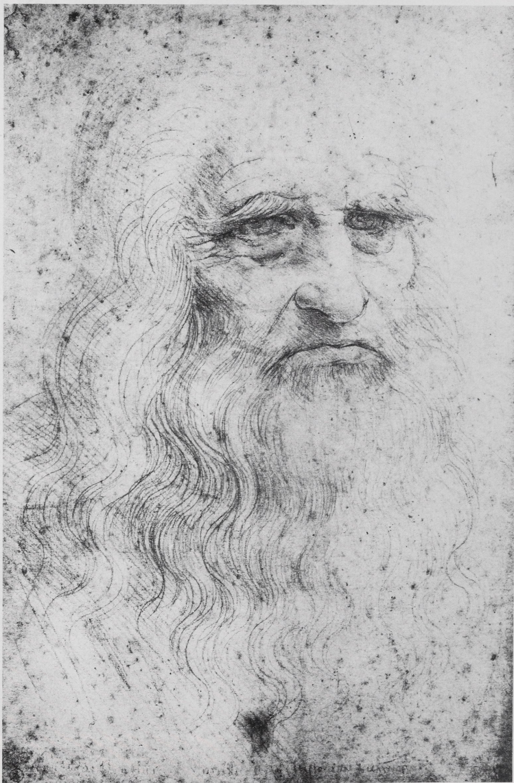
Abb. 4 Leonardo „Selbstbildnis“. Turin, Königliche Bibliothek (Chomon-Perino, Turin)