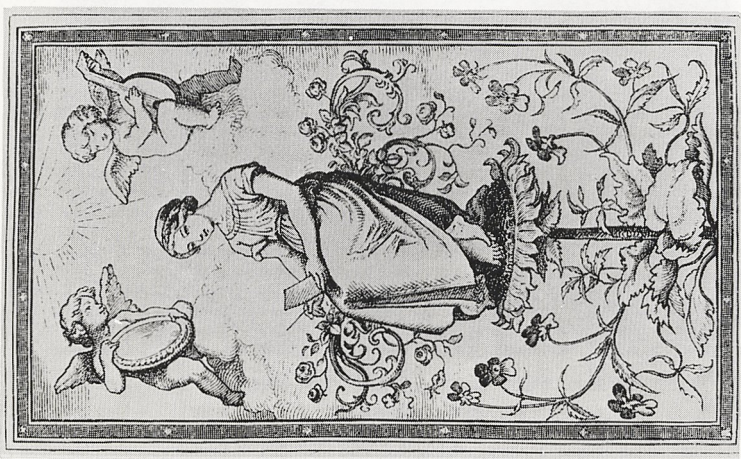
Abb. 6 a Ludwig Richter: Das Hausmütterchen. Holzschnitt, 1856