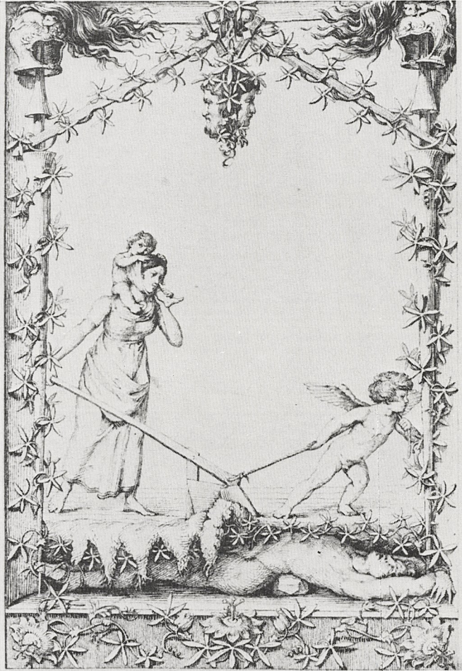
Abb. 5 Philipp Otto Runge: Fall des Vaterlandes . Federzeichnung, 1809. Hamburg, Kunsthalle