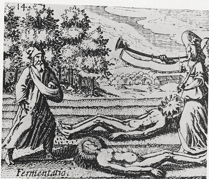
Abb. 4 Alchimistischer Sämann, Kupfer aus „Chymisches Lustgärtlein“, Frankfurt/M. 1624, fig. XXXXVI