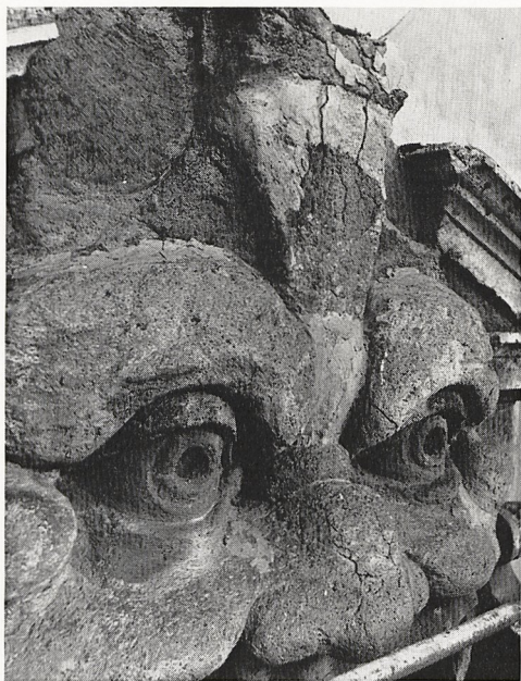
Abb. 3 a+b Rom, Pal. Zucari, linkes Maskenfenster vor und (unten) nach der Restaurierung