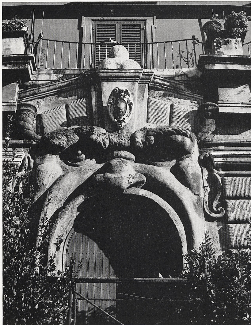
Abb. 2 Rom, Pal. Zuccari, Maskenportal vor der Restaurierung 1976