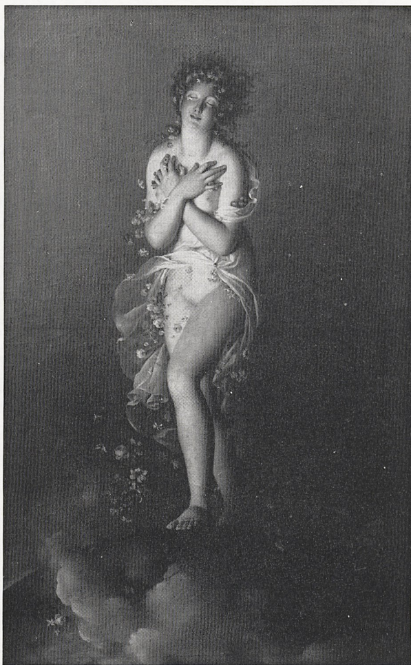
Abb. 8 François Gérard. Flora. Um 1802. Grenoble, Museum