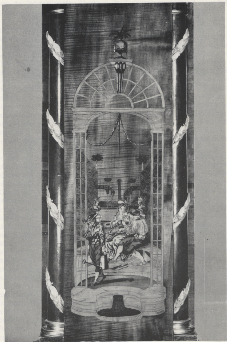
Abb. 3 Intarsienszene am Gehäuse der Standuhr Abb. 1