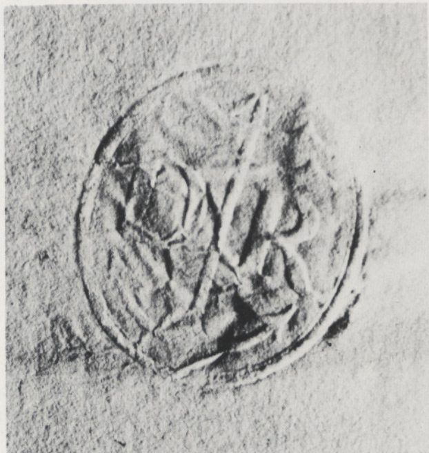
Abb. 4b Petschaft Roentgens aus den 1790er Jahren. Archiv der Brüdergemeinde Neuwied