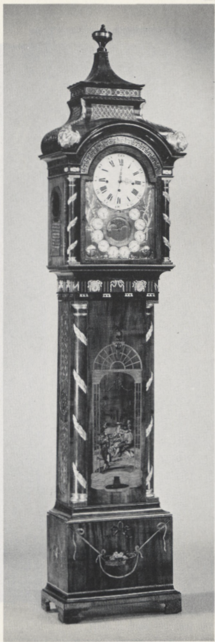
Abb. 1 Standuhr. New York, Metropolitan Museum of Art (ex Hessen-Cassel). Gehäuse Manufaktur David Roentgen; sign. Reusch. Entwurf nach Th. Chippendale