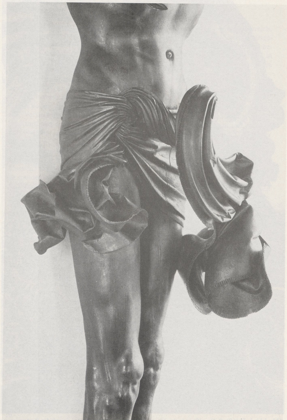
1911. "The Ruffled Man" by Augustus St. John. (The Ruffled Man, 1911, Augustus St. John, oil on canvas, 100 x 100 cm, The Metropolitan Museum of Art, New York City)