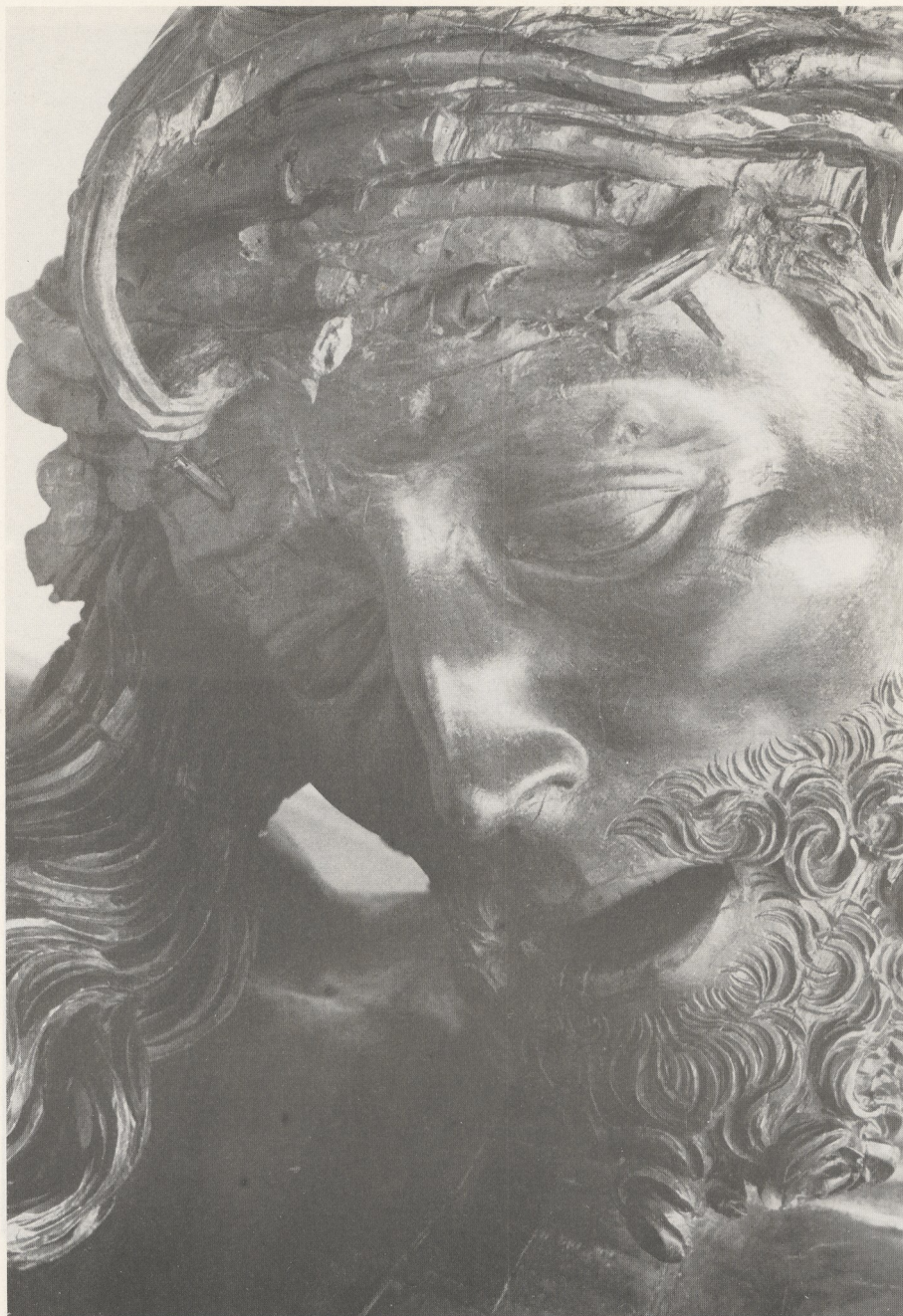
Abb. 1 bis 3 Veit Stoß, Crucifixus in der Nürnberger Lorenzkirche. Zustand nach der Restaurierung (Foto: Oellermann, Heroldsberg)