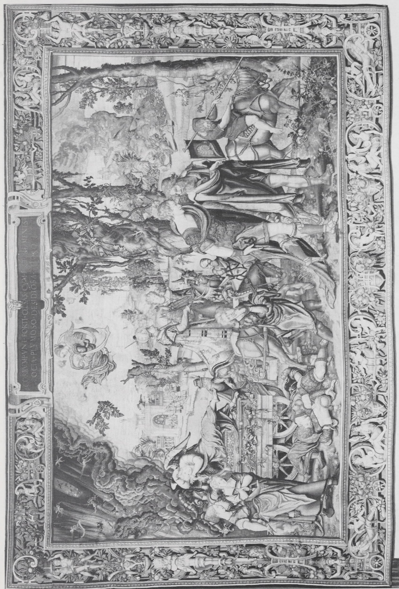
Abb. 1 Pieter Coecke van Aelst (Entwurf), Die Trägheit, aus dem Todsündenzyklus. Wien, Kunsthistorisches Museum