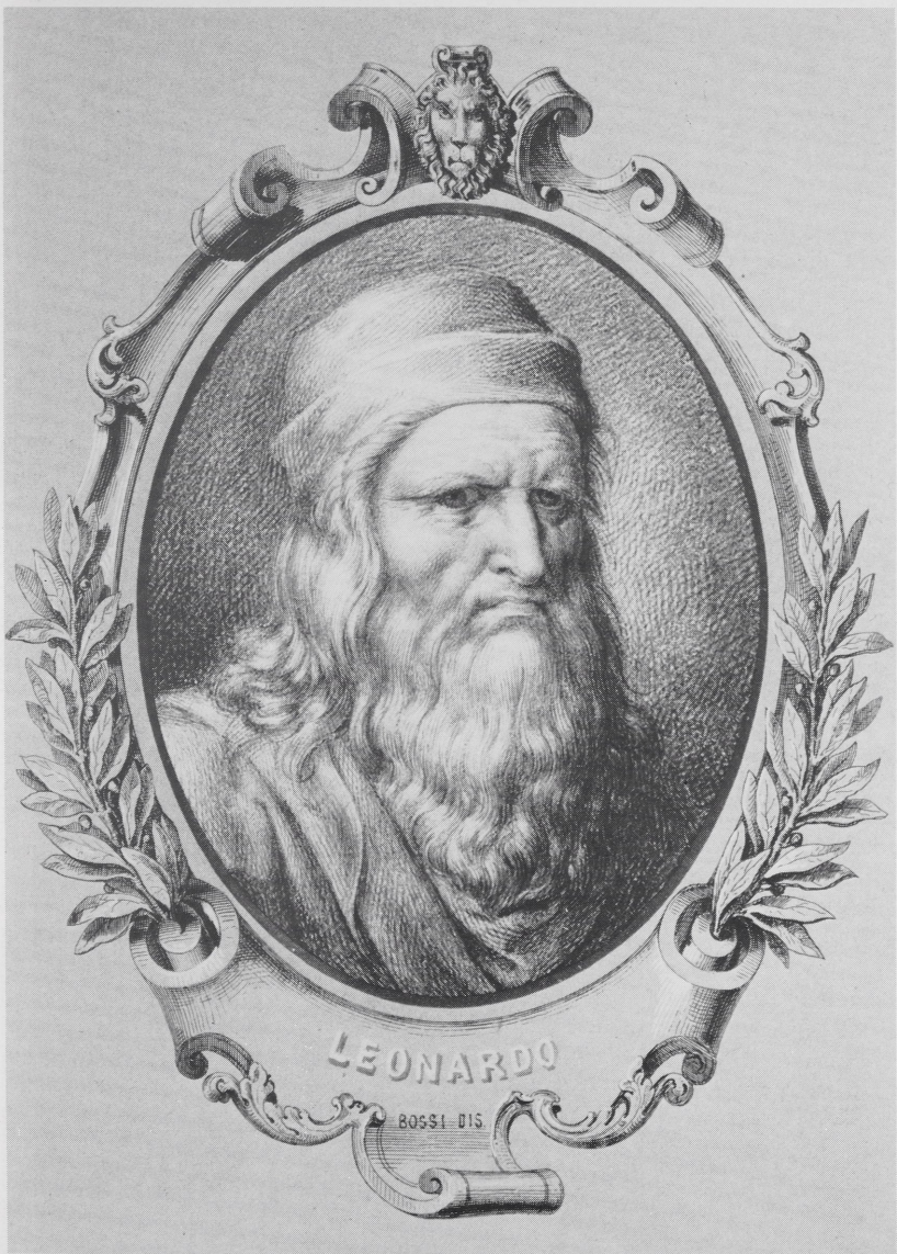
Abb. 3 Giuseppe Bossi, Bildnis Leonardos, Castello Sforzesco, Mailand