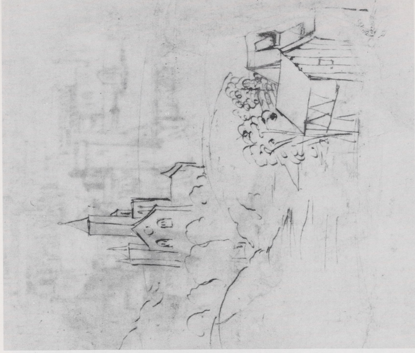
Abb. 4b Perugino-Kreis, Landschaftsskizze. Oxford, Ashmolean Museum