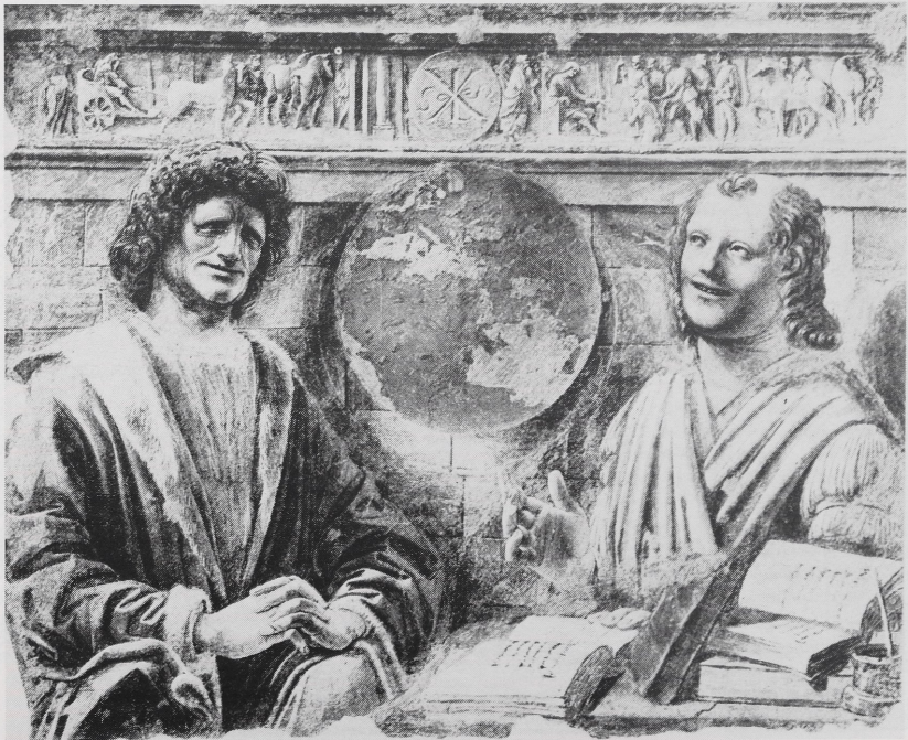
Abb. 2b Bramante, Heraklit und Demokrit, Fresko aus der Casa Panagirola, Pinacoteca di Brera, Mailand