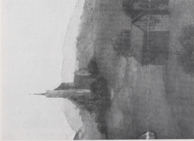
Abb. 4a Raffael, Colonna-Altar, Detail. New York, Metropolitan Museum