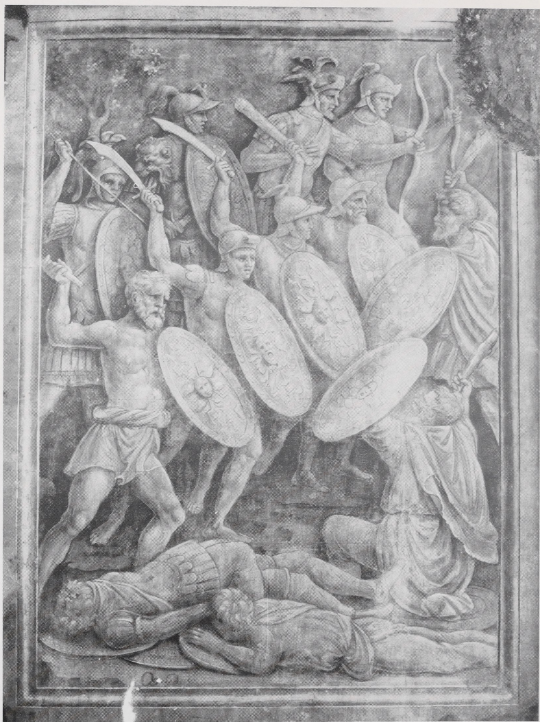
Abb. 4 Baldassarre Peruzzi, Römerschlacht. Ostia, Episcopio