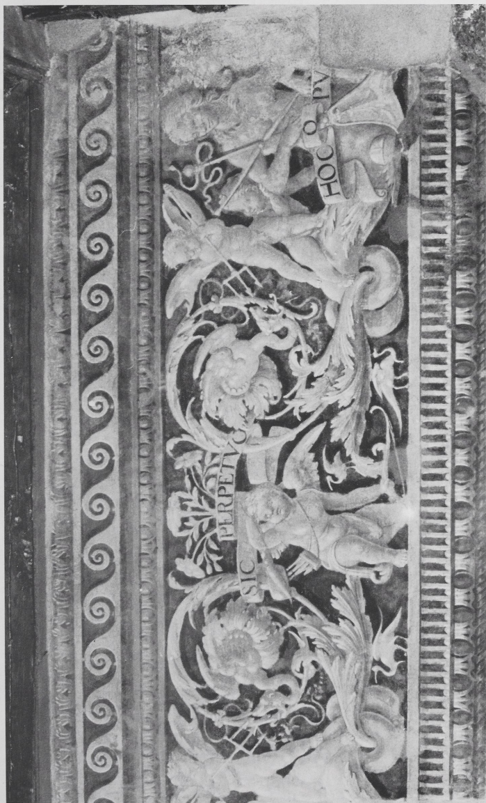
Abb. 3 Baldassarre Peruzzi, Wanddekoration im Episcopio, Ostia