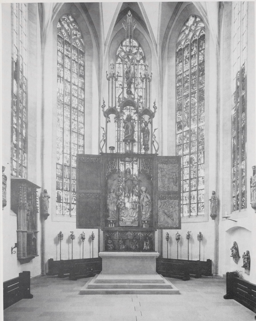
Abb. 1 Münnerstadt, Pfarrkirche, Hochaltar-Retabel ca. 1981