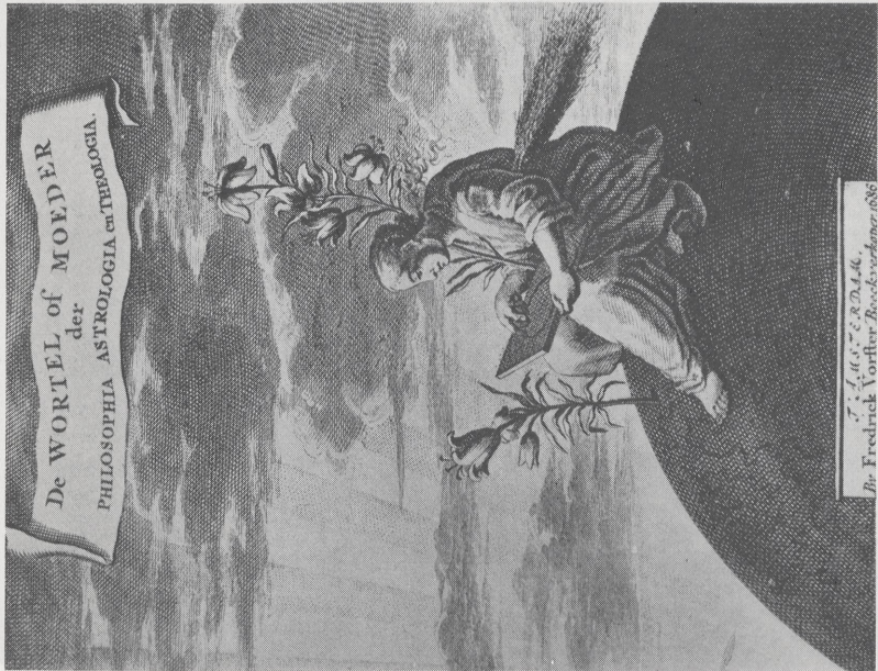
Abb. 8a Jakob Böhme: 'De Wortel of Moeder der Philosophia Astrologia en Theologia'. Titelkupfer der Ausgabe Amsterdam 1686