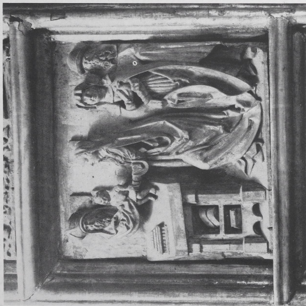
Abb. 7a Umkreis des Veit Stoß, Darbringung im Tempel (Ausschnitt aus der Rosenkranztafel). Zustand vor der Restaurierung. Nürnberg, German. Nationalmuseum (Foto GNM)