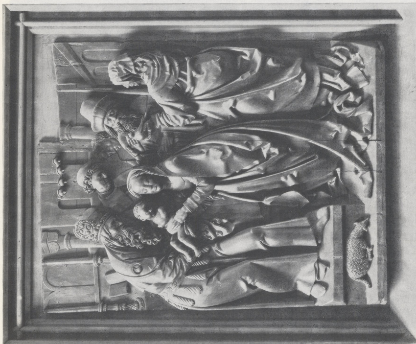
Abb. 6a Veit Stoß, Darbringung im Tempel (Bamberger Altar, Ausschnitt). Bamberg, Dom