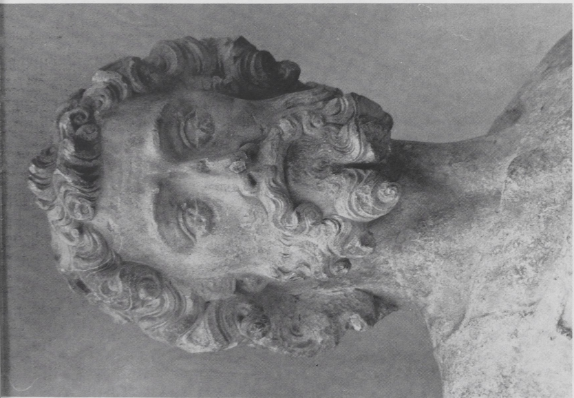
Abb. 3a Paris, Musée Cluny. Kopf der Apostelstatue von Guillaume de Nourriche