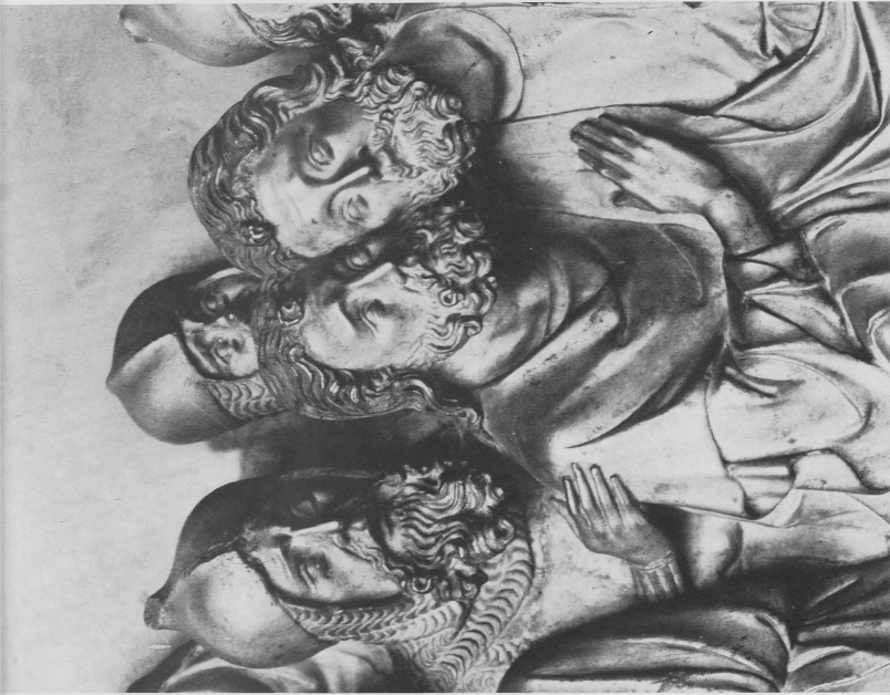
Abb. 3b Antwerpen, Museum Mayer van den Bergh. Relief von einem Passionsretabel (Ausschnitt)