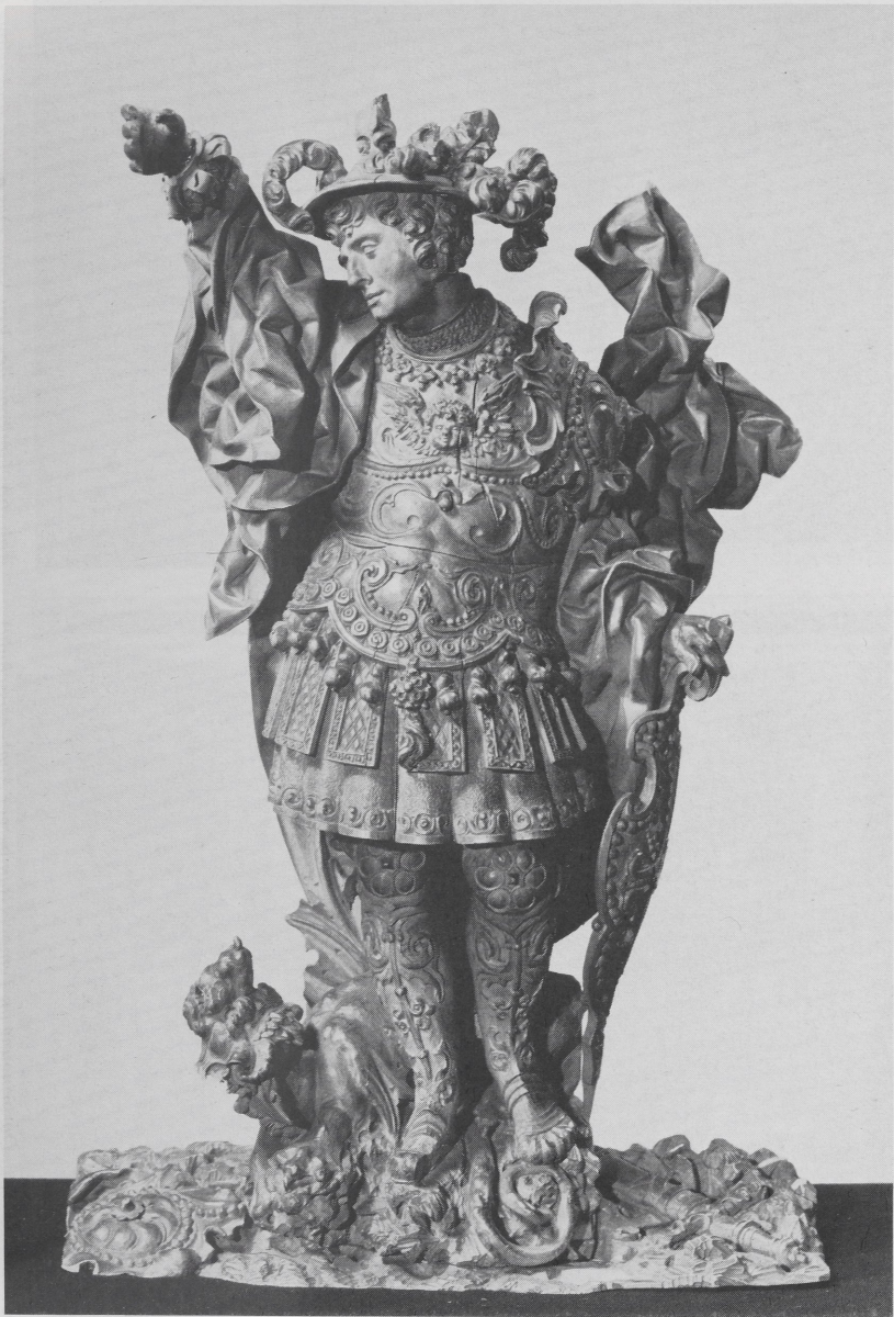
Abb. 5 Hl. Georg. Niederländisch, um 1540. London, Victoria and Albert Museum