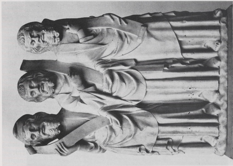
Abb. 2b Paris, Louvre. Fragment vom ehern. Hochaltar in Maubisson