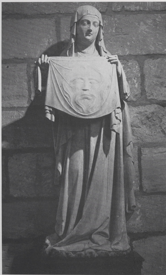
Abb. 1 Écouis (Eure), Kollegiatskirche. Hl. Veronika