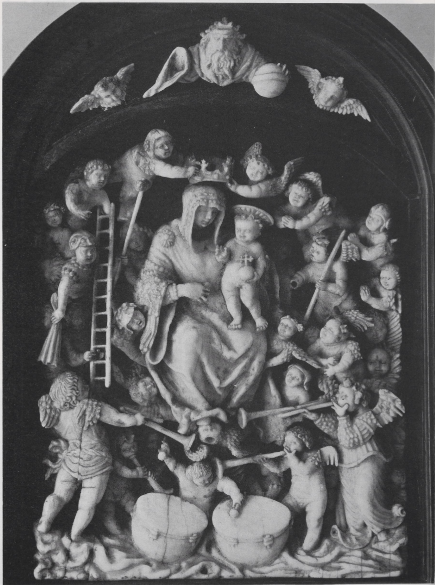
Abb. 4 Hausaltärchen aus Ebenholz und Elfenbein, um 1530 (?) und Anfang des 17. Jhdts. Ehem. Paris, Kunsthandel