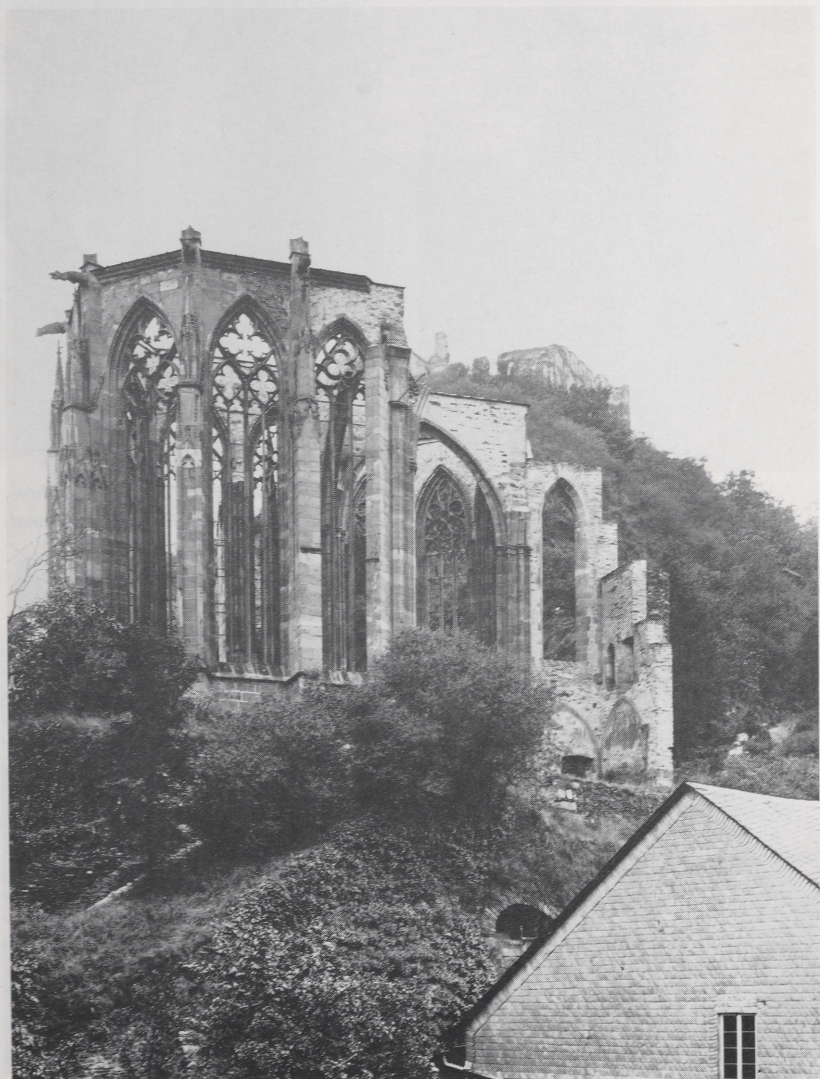
Abb. 1 Bacharach, Wernerkapelle. Zustand zu Anfang der 20er Jahre (Marburg 23929)