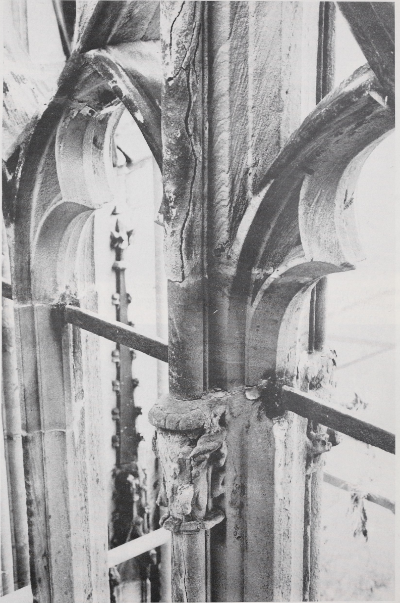
Abb. 4 Bacharach, Wernerkapelle. Maßwerk im Chor, Zustand 1982 (LA 1546/35)