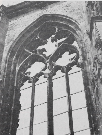
c) Chorfenster, Zustand 1979 (LA R 424/10)