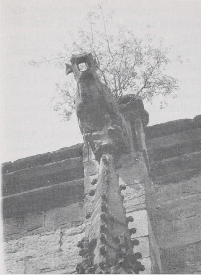
Abb. 2 Bacharach, Wernerkapelle. a) Wasserspeier an der Südseite des Chors, Zustand 1980 (Wolff)