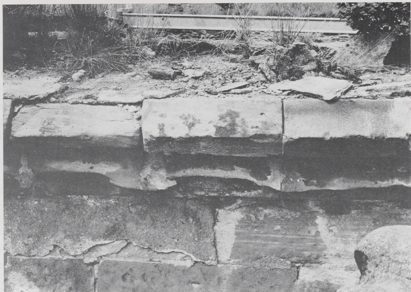
Abb. 3 Bacharach, Wernerkapelle.

a) Dachgesims an der Südseite des Chors, Zustand 1982 (LA 1544/6a)