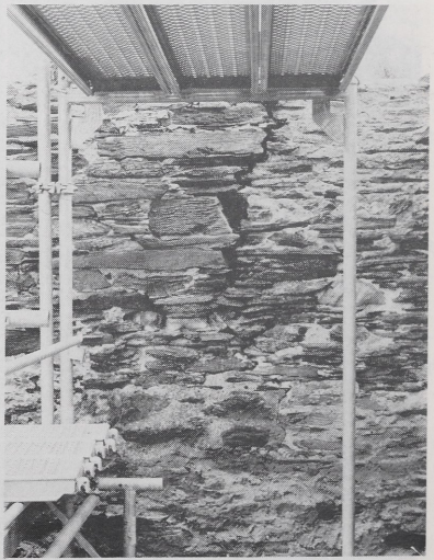
d) Triumphbogen, Ostseite, Zustand 1982 (LA 1545/7)