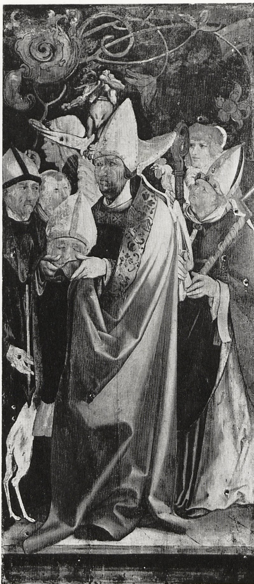
Abb. 5 Matthias Grünewald: Dionysiusflügel vom Bintlacher Altar. Lindenhardt, evang. Pfarrkirche