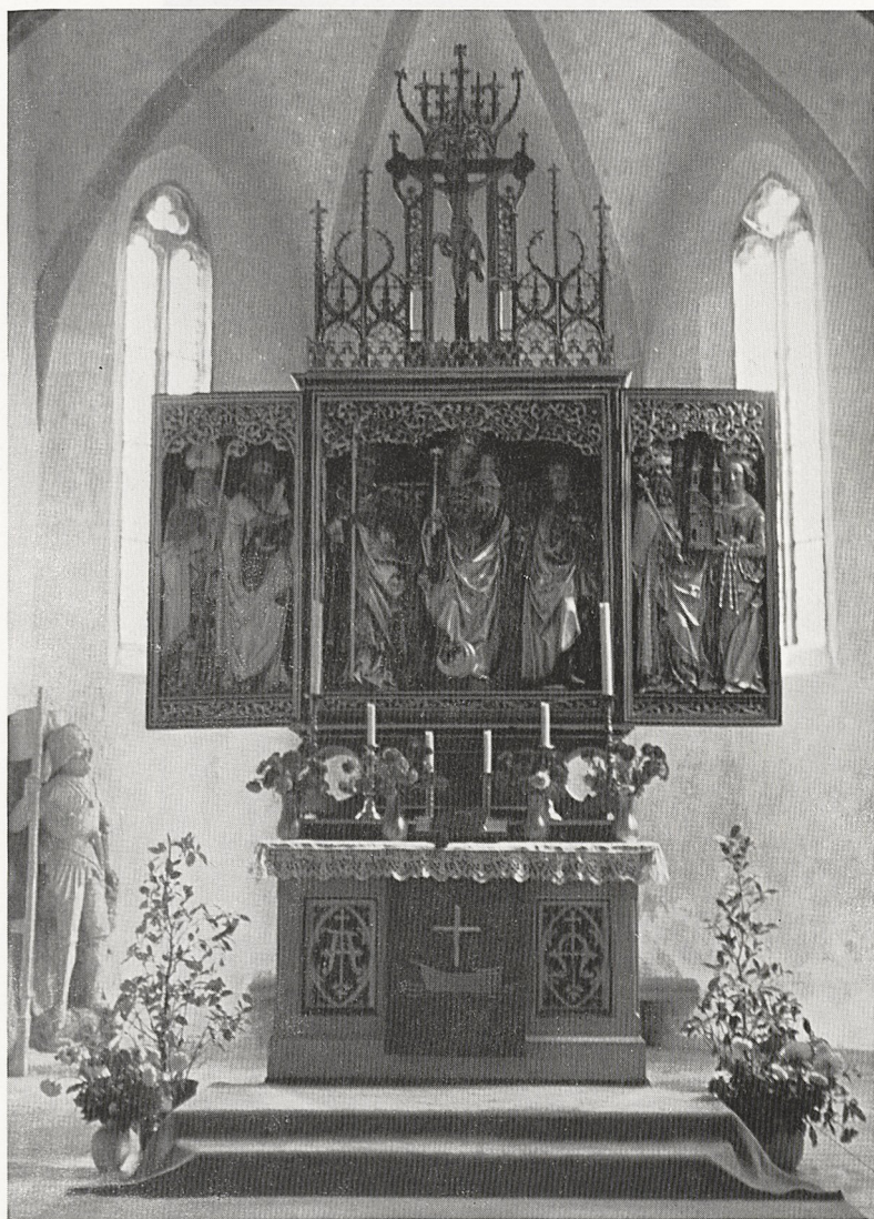
Abb. 3 Lindenhardt, evang. Pfarrkirche von Bindlach, mit geöffneten Flügeln