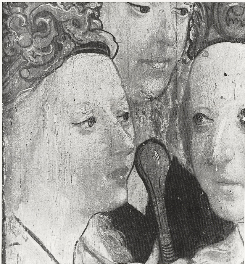
Abb.7 Detail aus Abb.4: Köpfe der Hll. Katharina, Margareta und Barbara