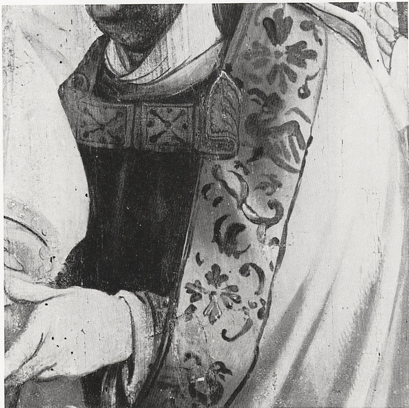
Abb. 6 Detail aus Abb. 5: Ornament auf dem Mantelsaum des hl. Dionysius