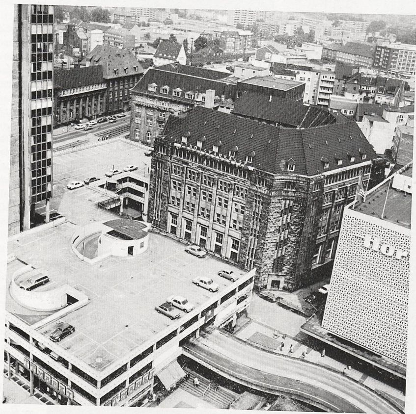
Abb. 2 Dortmund, ehem. Gebäude der Stadtsparkasse. Im Vordergrund Hochgarage, rechts Kaufhaus Horten