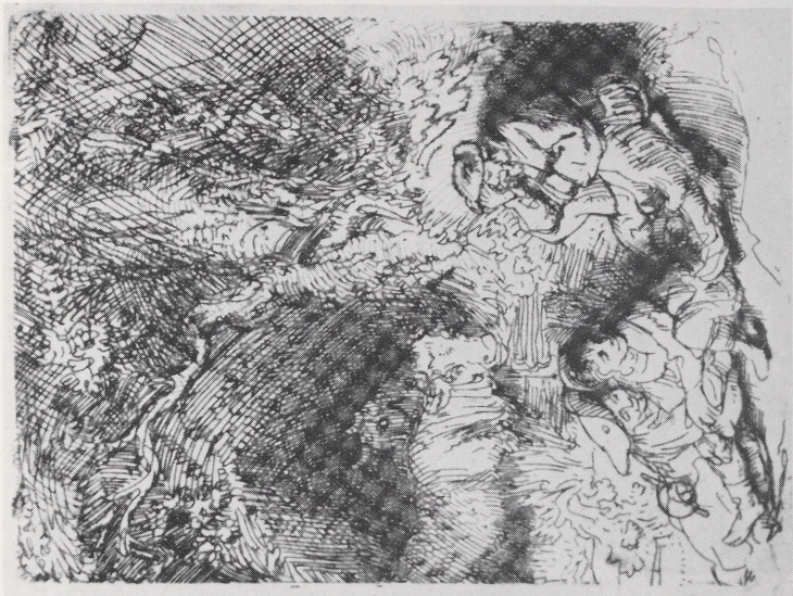
Abb. 4b Rembrandt, Das Pärchen und der schlafende Hirt, Radierung (B. 189), um 1644