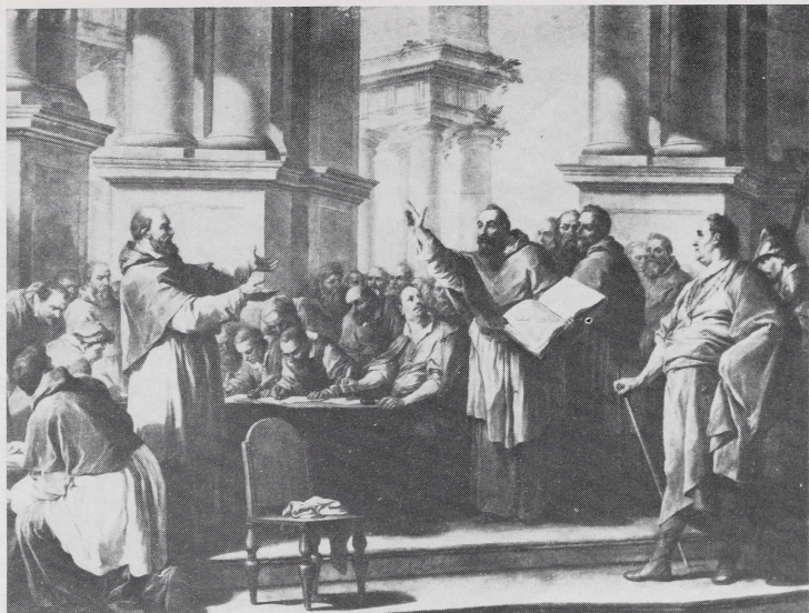
Abb. 3a Carle van Loo, St. Augustin disputant contre les Donatistes , Salon 1753, Paris, Notre-Dame-des-Victoires