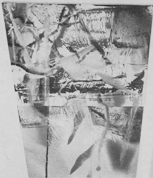
Abb. 2 Kassel, documenta 7. Arbeiten von Robert Mangold (links) und Gerhard Richter (rechts)